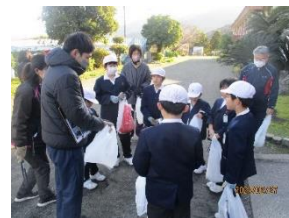
道の駅周辺のゴミ拾い 護岸道路のゴミ拾い