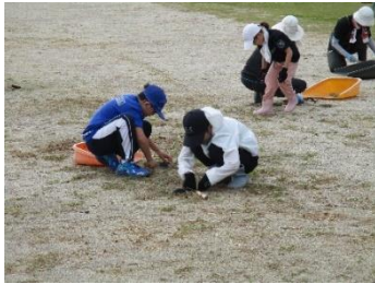
下校庭の草取りの様子