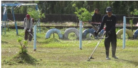
下校庭の草払いの様子