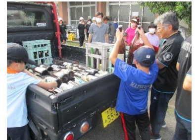
びんを集める様子

P T A 空きびん回収を年 1 回実施している。校区内 2 箇所に分かれて、道路沿いに出ているびんを保護者と子供たちが協力して回収している。多くのびんを回収したり、びんの回収業者の方からこのびんがどのように再利用されているかを聞いたりすることで、リサイクルの大切さや意義について実体験を通して学ぶことができている。