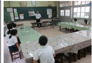
全校朝会 校長講話