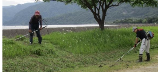
護岸土手の草払いの様子