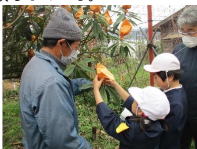
袋がけ（霜・灰対策）