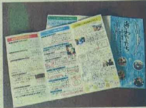
国分小学校児童が作った「海とわたしたち」リーフレット