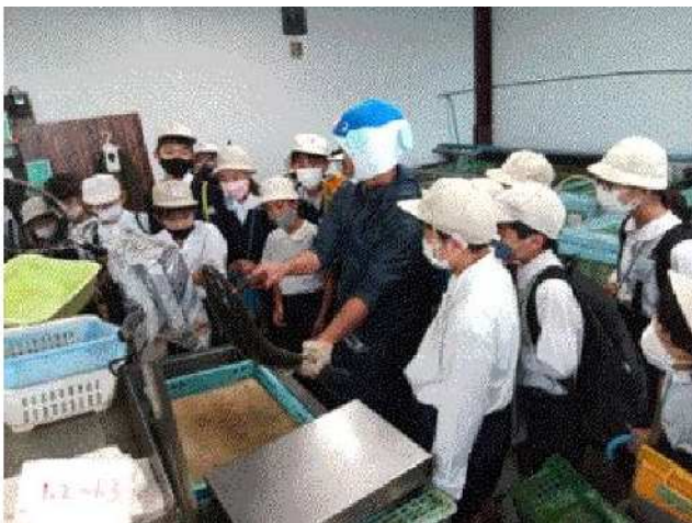
【課題解決：鮮魚店取材】