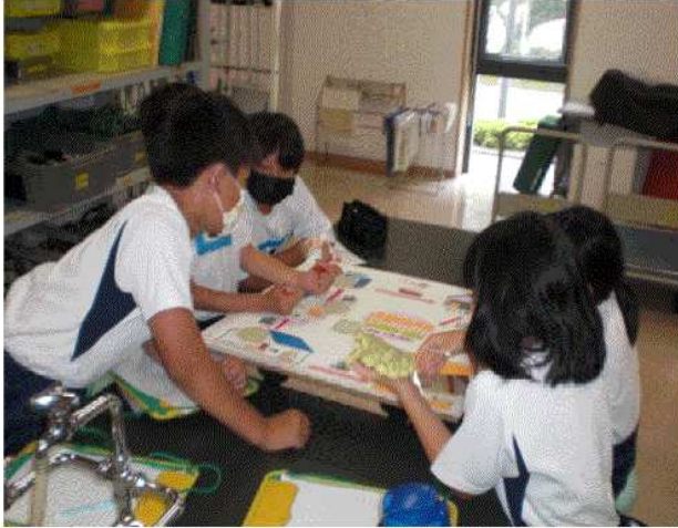
【環境学習：かごしま環境未来館】