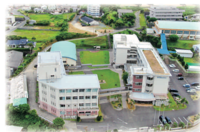
空撮による徳之島高校