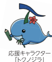
応援キャラクター 「トクノジラ」