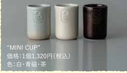
“MINI CUP” 価格:1個1,320円(税込) 色:白・青磁・茶

沈壽官窯とランドスケーププロダクツが共同で制作する陶器のシリーズ。グラスとしてだけでなく、中にキャンドルを入れるなどインテリアとしてもお使いいただけます。初めての薩摩焼きに、このミニカップはいかがでしょうか。