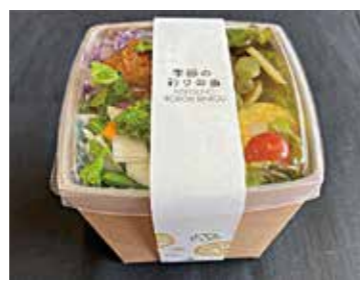
季節の彩りお弁当