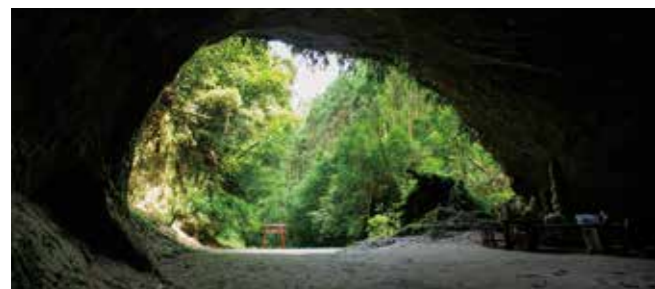
みずのくちのうち #溝ノ口洞穴 #曾於のパワースポット

溝ノ口洞穴 霧島山系の湧き水が侵食し数千年の歳月をかけてできた大きな洞穴で、県の天然記念物に指定されている。幅14.6メートル、高さ最大6.4メートルの洞穴内部から入口を振り返ると、まるで別世界。大自然のパワーを全身で感じてみよう。