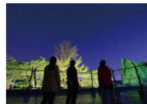
星空観測体験(ガイド付き)

星の宿 (たからべ森の学校内) 教室を改装した宿泊ルームには、ドミトリタイプ(大部屋)と、少人数向けの個室があり、五右衛門風呂やキッズルームも完備。友達同士や家族連れで学校に泊まって、大自然を満喫しよう。スポーツ合宿にもおすすめ。