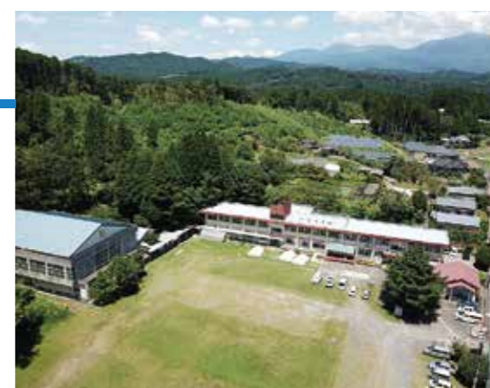
#たからべ森の学校