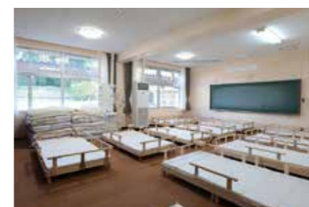
美術室を改装した大部屋(10名~利用可)

星の宿 (たからべ森の学校内) 教室を改装した宿泊ルームには、ドミトリタイプ(大部屋)と、少人数向けの個室があり、五右衛門風呂やキッズルームも完備。友達同士や家族連れで学校に泊まって、大自然を満喫しよう。スポーツ合宿にもおすすめ。