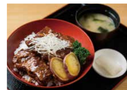
黒豚ナンコツ味噌煮丼

新鮮野菜や加工品をはじめ、黒豚や黒毛和牛の直売コーナーが人気の道の駅。レストラン「きらら」は黒豚を使ったメニューが充実。ワンコインランチのほか、軟骨をトロトロに煮込んだ看板メニュー「黒豚ナンコツ味噌煮丼」が人気！