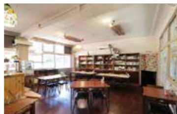
職員室を改装したカフェ