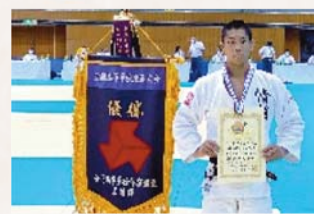
2021全国高校総合体育大会 柔道男子81kg級 優勝