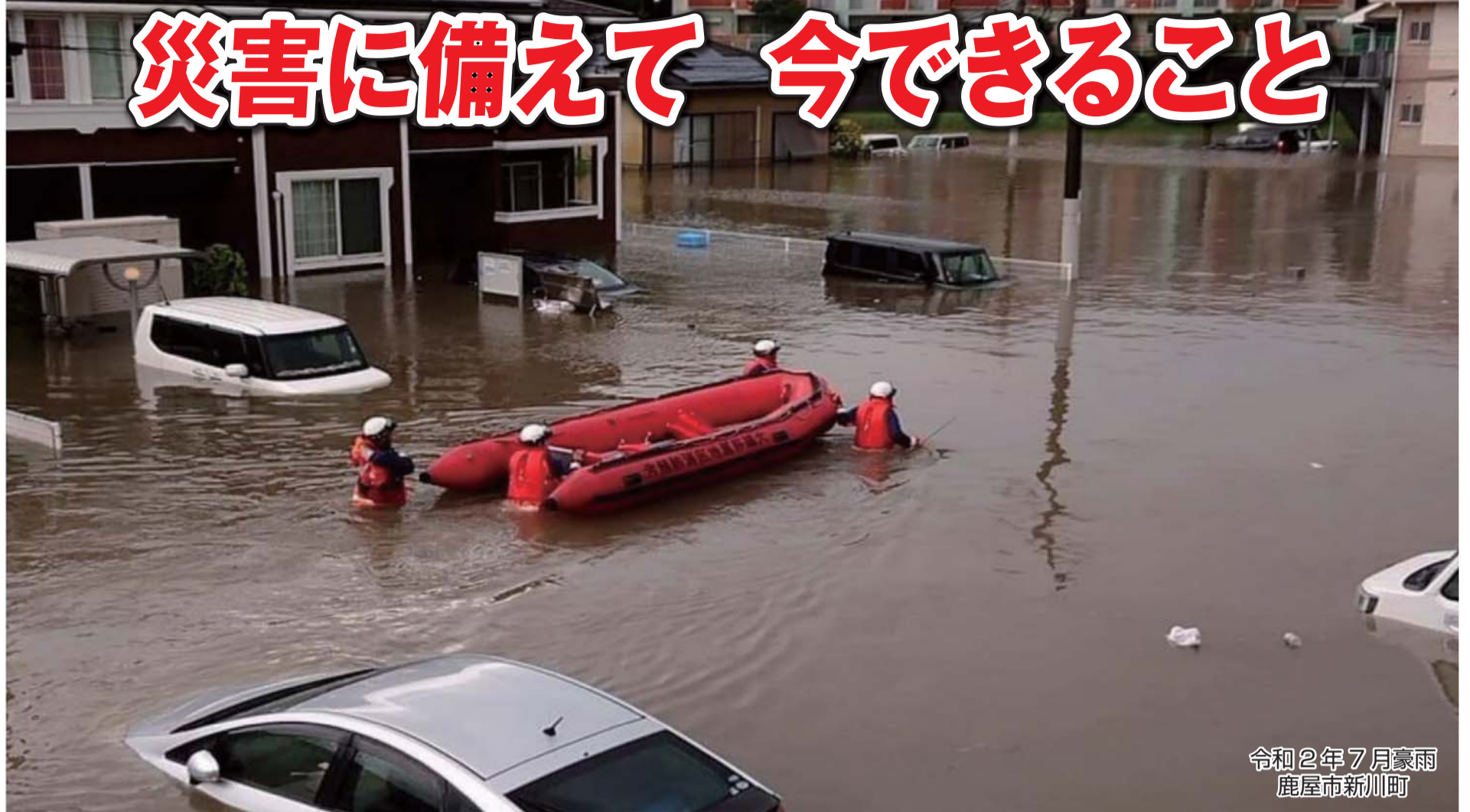
令和2年7月豪雨 鹿屋市新川町

1~2面 災害に備えて 今できること 3面 健康づくりやボランティア活動を通して お得なポイントを貯めてみませんか! / 感染予 防を徹底しましょう / ぐりぶークーポンを使用 して花・茶を購入しませんか? (6月7日配信 開始) / キャッシュレス導入経費を補助します 4面 情報BOX / 特産品プレゼント