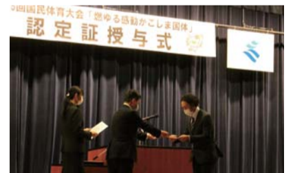
塩田知事から候補選手への認定証授与

延期となった「かごしま国体」の候補選手への認定証授与式を11月4日に開催し、37競技の選手代表に対して、これまでの努力に敬意を表し、候補選手の証として認定証を授与しました。