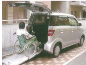
高齢者・障害者などの移動支援(取り組みの一例)

県民の皆さまからの「ふるさと納税(かごしま応援寄附金)」を活用して、県内のNPO法人や地域コミュニティが取り組む地域貢献活動を支援する「地域貢献活動応援プロジェクト」を実施中です。