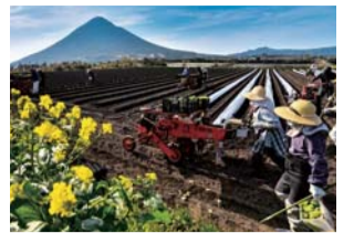
県知事賞「葉たばこの植え付け」

豊かな自然、ゆとり、やすらぎ、うるおいなど、ふるさとかごしまの農業と農村の魅力を表現した写真展を開催します。ぜひご覧ください。