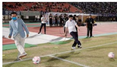
両県知事によるキックインセレモニー

「かごしま国体・かごしま大会」の2023年開催決定を受け、本来であれば、かごしま国体総合開会式が行われる予定だった10月3日、白波スタジアムにおいて記念イベントを行いました。