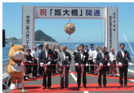
開通式の様子(8月29日)

中甌島と下甌島をつなぐため、平成18年度に「甌大橋」を含む県道の整備工事が始まりました。海峡の速い潮流や台風、冬季風浪など厳しい自然条件下の難工事でしたが、8月29日、総事業費約320億円をかけ、ついに完成しました。延長は約1.5kmで、県内最長の橋となります。