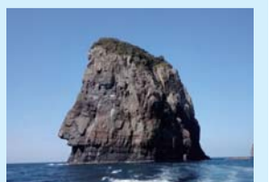
ナポレオン岩(下甌島)