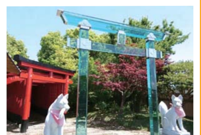
ガラスの鳥居が魅力の 神徳稲荷神社(鹿屋市)