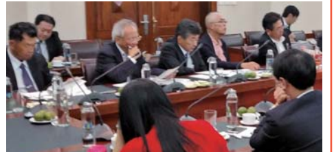
JAと農業農村開発省との意見交換