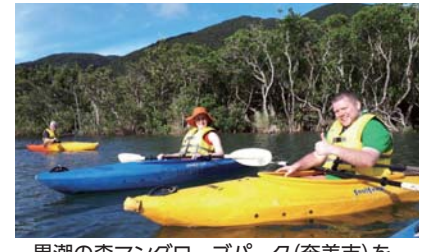
黒潮の森 mangrove パーク(奄美市)を視察する英国人フリーライター