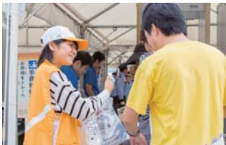
ボランティアによる案内

運営ボランティア 5,200人 ※2020年4月1日現在で中学生以上の方ならどなたでも参加できます。