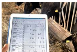
生育状況を管理するタブレット