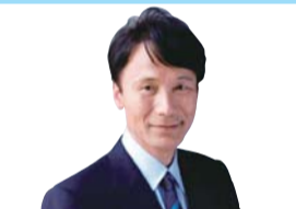
鹿児島県知事 三反園 訓