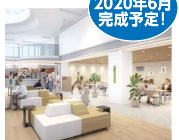
出発ロビーの完成イメージ図