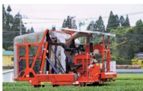
自動走行するロボット茶摘採機