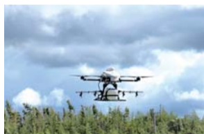
ドローンによる農業散布