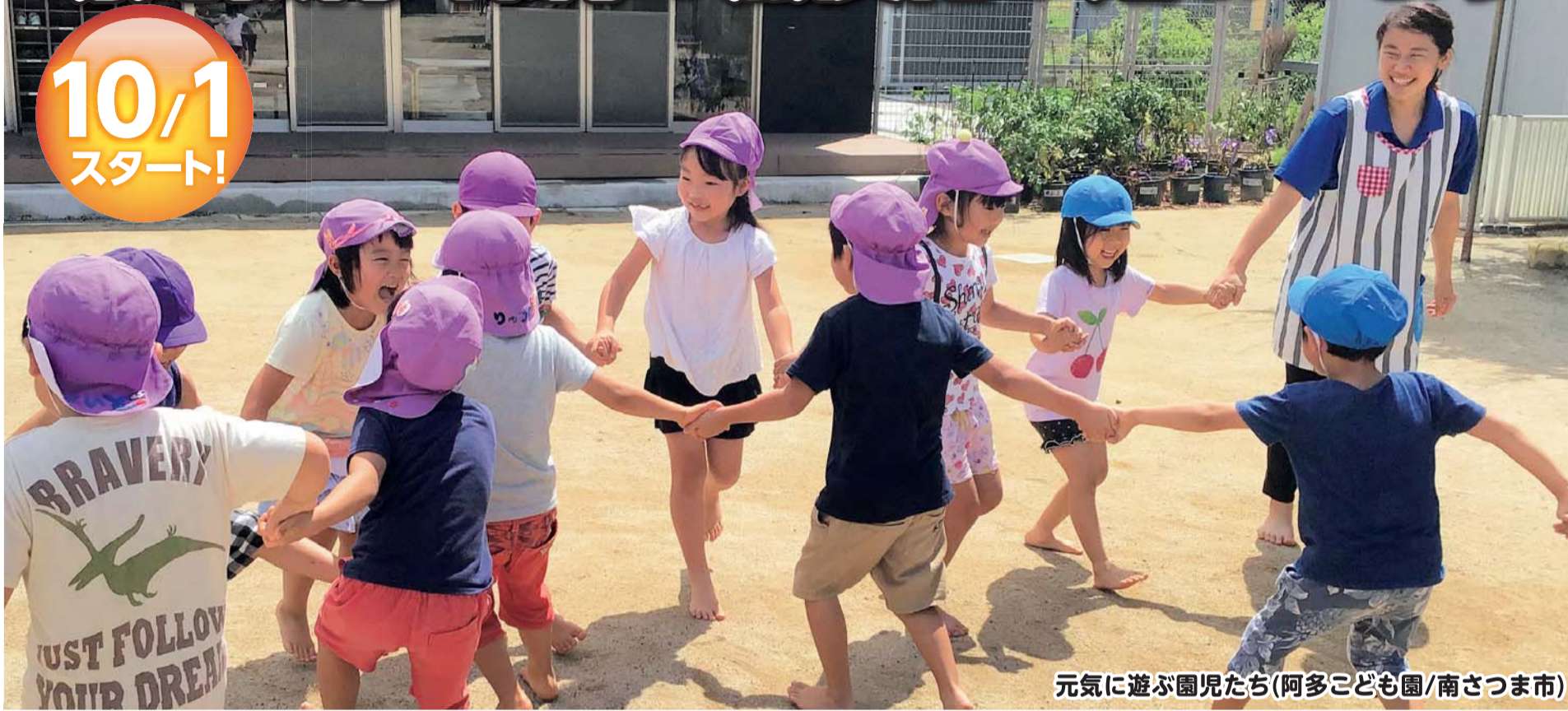
元気に遊ぶ園児たち(阿多こども園/南さつま市)