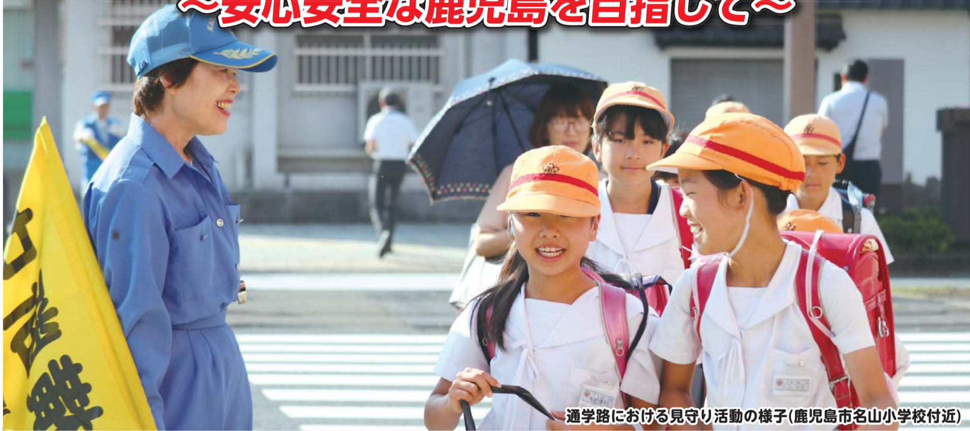
通学路における見守り活動の様子(鹿児島市名山小学校付近)