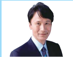
鹿児島県知事 三反園 訓

鹿児島の未来を担うのは子どもたちです。 子どもたちが地域の中で安心して過ごせるようにするためには、オール鹿児島で子どもたちの安全確保に取り組む必要があります。 また、10月からは、幼児教育・保育の無償化が実施されます。引き続き、子育て世代にとって産み育てやすい鹿児島をつくるため、切れ目の無い支援を展開していきます。 県内どこに住んでいても、子どもたちが安心して健やかに成長できる鹿児島を目指して、全力で取り組んでまいります。