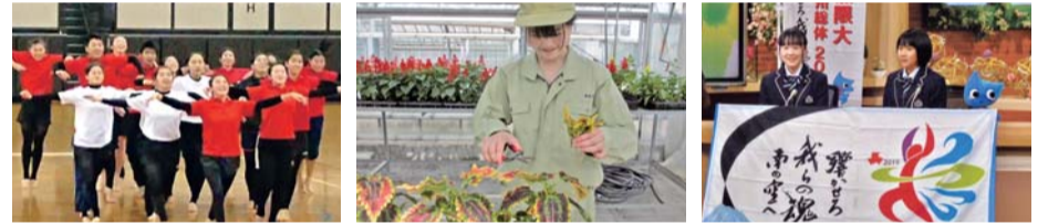
総合開会式での歓迎演技の練習 競技会場を彩る草花の栽培 テレビに出演しての広報

県内99校の多くの高校生たちが、大会を支える鹿児島ならではの「高校生活動」に取り組み、訪れる皆さんをもてなします。