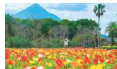
フラワーパークかごしま