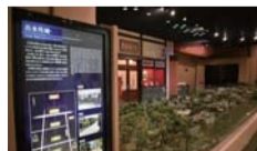
歴史資料センター黎明館