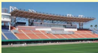
白波スタジアム(県立鴨池陸上競技場)