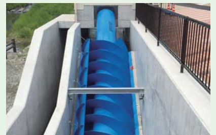
薩摩川内市の小鷹水力発電所