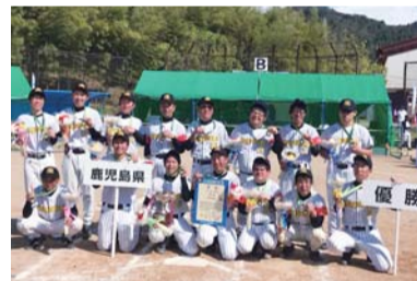
視覚障害者によるグランドソフトボール競技で優勝

県では、両大会に向けて施設整備や競技力向上、気運の醸成などのさまざまな取り組みを進めています。