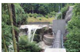
日置市の永吉川水力発電所