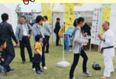
カウントダウンイベント (H30.10 鹿児島市)