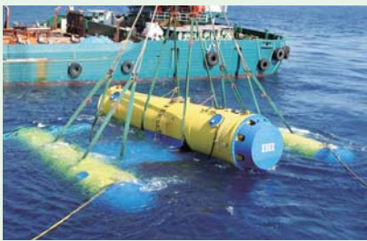
口之島(十島村)での実証実験の様子