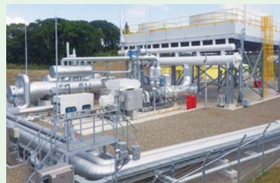
指宿市のメディポリス指宿発電所