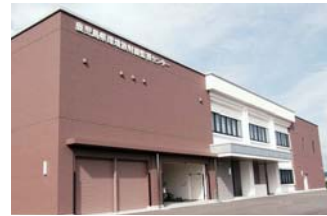
新しい環境放射線監視センター

環境放射線監視センターを新たに整備し、薩摩川内市と鹿児島市に分散していた機能を統合して監視体制の充実を図りました。