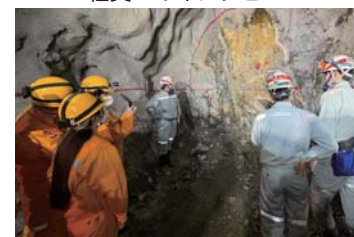
働く現場を取材！（菱刈鉱山）