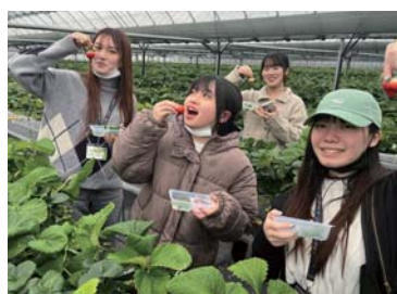
遊ぶ魅力を体感！ （いちご狩り）