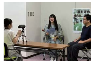
社員へのインタビュー

私はこれまで、日本や世界の将来にかかわる仕事に携わりたいという思いから、県外へ出るべきだと考えていました。しかし、取材を通じて、世界で高く評価されている技術をもって人々の生活に真剣に向き合う県内企業と出会い、「鹿児島だからできない」ではなく、「どのように世界とつながり、社会に貢献していくのか」という視点で就職先を考えるようになりました。