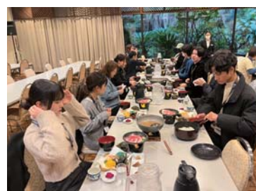
懐かしい味に感動！ （県産食材の昼食）