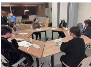
先輩社員との交流