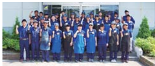
給水設備製品製造業 (K社) / 霧島市

土木・建築工事を通して、安心・安全・豊かな暮らしづくりに貢献しています。女性活躍や仕事と子育ての両立支援など、男女ともに働きやすい職場づくりにも力を入れています。