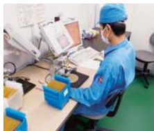
半導体部品製造業 (O社) / 伊佐市

「従業員の子どもたちが働きたいと思える魅力的な会社」を目指しています。モノづくりに関するさまざまな改善活動を行いながら、皆さんの生活に欠かせない給水装置を開発・製造しています。また、子育て支援活動にも力を入れ、働きやすい環境づくりに取り組んでいます。