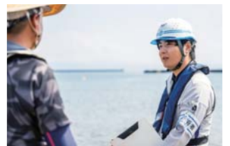
総合建設業 (N社) / 鹿児島市