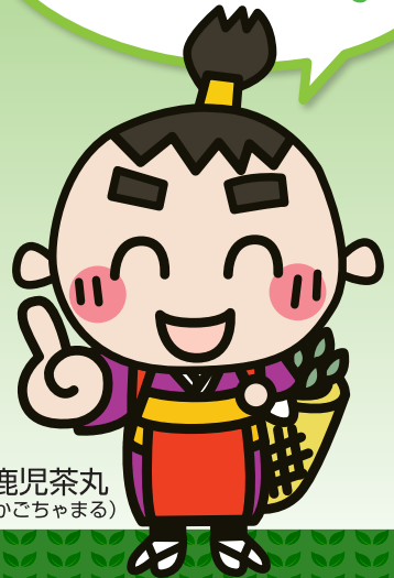
鹿児茶丸 (かごちやまる)