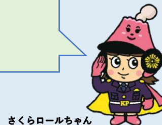
さくらロールちゃん