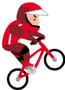
装备不齐全（没有刹车）