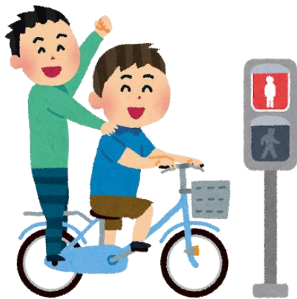
骑车载人且闯红灯