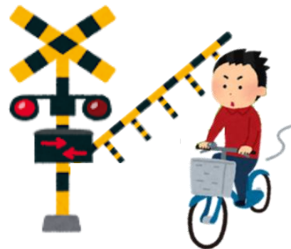
进入铁路轨道路段器的区域