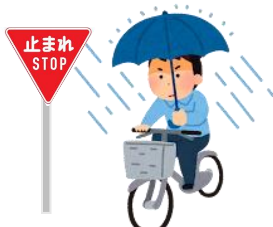
骑车打伞且不遵守停止标志