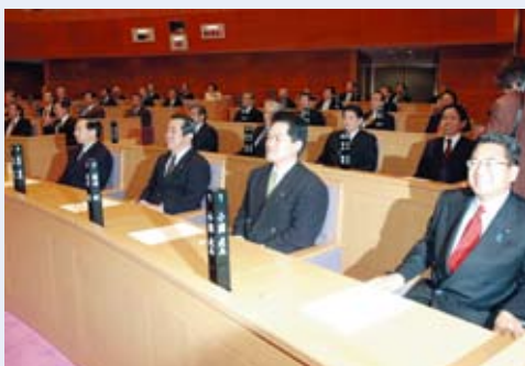
伝統的工芸品産業の振興のためネクタイ等大島紬製品を身につけ定例会に臨む議員

観光関係諸団体とも連携しながら、積極的な観光振興の施策を講ずるための調査研究を行うとともに、その推進を図る。