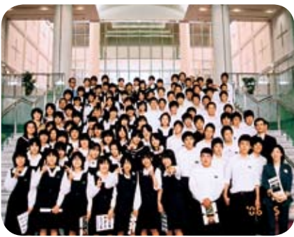
南さつま市立万世中学校の皆さん

また、議会庁舎を見学することもできますので、希望される方は気軽にお申し出ください。