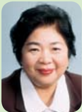
副議長 尾辻 義 (自民) 鹿児島市区選出