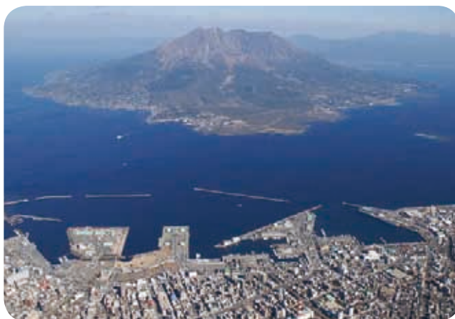
鹿児島港(本港区・新港区)

各常任委員会は、付託議案のすべてを可決又は承認すべきものと決定し、請願・陳情についての採択・