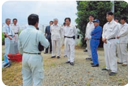
花き生産現場の視察(沖永良部島)

農林水産委員会は、農林水産業の振興対策等を主眼に、五月に大島地区、七月に大隅地区、十一月に鹿児島・北薩・始良地区の行政視察を行いました。