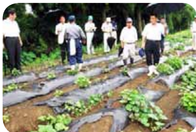
農作物の被害状況を調査(鹿屋市輝北町)

同議員連盟では、今後、効果的な鳥獣被害防止対策の調査・検討など活発な活動を行うこととしていきます。