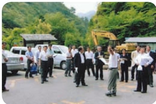
縄文杉登山道起点の荒川登山口の視察(屋久島町)

精神科の診療の充実に向けている県立病院などの施設をはじめ、地域医療に貢献する種子島産婦人科医院、がんの先端治療