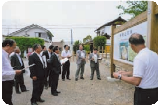
野間之関整備事業の現場(出水市)

危機管理及び消防防災対策については、桜島の火山活動研究センターを訪問し、最近、活動が活発化している桜島や、県内の活動火山の動向等について調査したほか、垂水市市木地区自主防災組織の方々との意見交換を行いました。