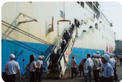
鹿児島港の視察(鹿児島港新港区)

県土の保全及び生活環境の整備については、新川の浸水対策や西之谷ダムなどについて調査しました。