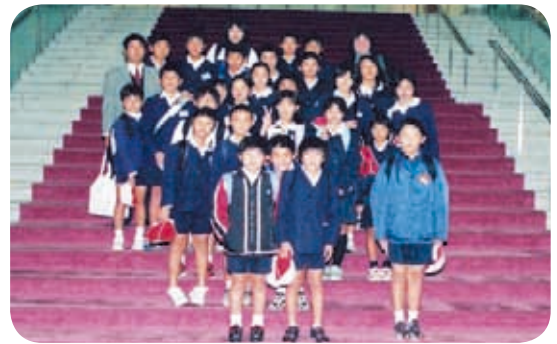
南さつま市立笠沙・玉林・赤生木小学校の皆さん