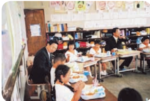
児童とのふれあい給食(さつま町立佐志小学校)

文教商工観光労働委員会は、商工業及び観光振興対策、労働対策、教育振興対策を主眼に、五月に鹿児島・北薩地区、七月に始良・伊佐地区、八月から九月にかけて大島地区の行政視察を行いました。