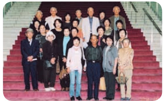
鹿児島市吉野北新生会の皆さん