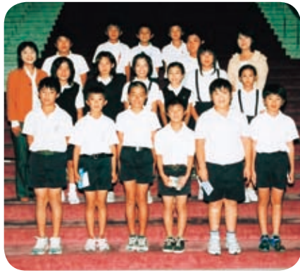
南九州市立宮脇小学校の皆さん

県議会の本会議は、誰でも傍聴できます。ただし、小学生の児童及び乳幼児については議長の許可が必要です。 傍聴席には、補聴設備及び車椅子用のスペースもあります。 常任委員会、特別委員会についても委員長の許可を得て傍聴することができます。 なお、手話通訳又は要約筆記を希望される方は、傍聴希望日の五日前までに御連絡ください。 また、議会庁舎を見学することもできますので、希望される方は気軽に申し出てください。