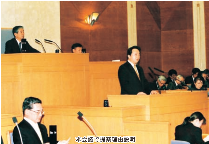
本会議で提案理由説明