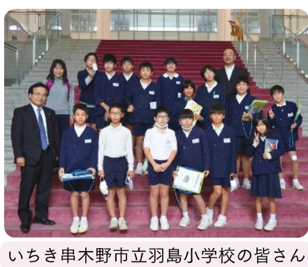
いちき串木野市立羽島小学校の皆さん

本年第2回定例会から、発言内容をリアルタイムで字幕表示する機能を導入します。詳しくは、県議会ホームページをご覧ください。