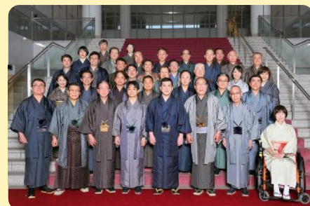
大島紬の着物姿で本会議に出席し、伝統的工芸品をPR