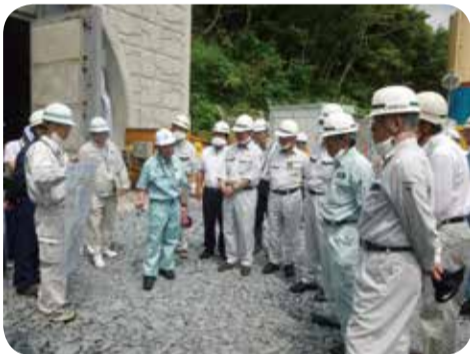
名瀬瀬戸内線(根瀬部国直工区)の宮古崎トンネル工事現場=大和村・5月

○地域振興対策について 地域活性化や地域の魅力発信に取り組んでいる地区コミュニティ協議会を訪問し、活動内容の説明を受けた後、課題等について意見交換を行いました。