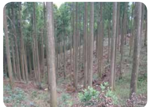
間伐施行箇所 (ふるさとの森生産性強化対策事業)