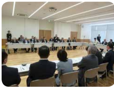
地域振興に取り組む出水市地区コミュニティ協議会との意見交換=出水市・11月

○地域振興対策について 地域活性化や地域の魅力発信に取り組んでいる地区コミュニティ協議会を訪問し、活動内容の説明を受けた後、課題等について意見交換を行いました。