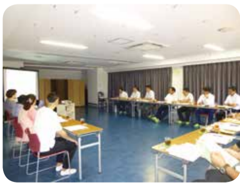
幼保連携型認定こども園の職員との意見交換=鹿児島市・7月

○保健・医療・福祉対策について 幼保連携型認定こども園を訪問し、子育て支援の取組について意見交換を行ったほか、県立大島病院を訪問し、ドクターヘリの運航状況や地域医療の課題等について調査を行いました。