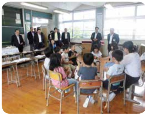
義務教育学校の授業を視察=出水市・5月

○教育振興対策について 義務教育学校、特別支援学校、加工品開発等を行っている高等学校の取組について調査を行い、授業等を視察しました。 また、文化財を活用した観光振興に取り組んでいるNPO法人の方々との意見交換を行いました。