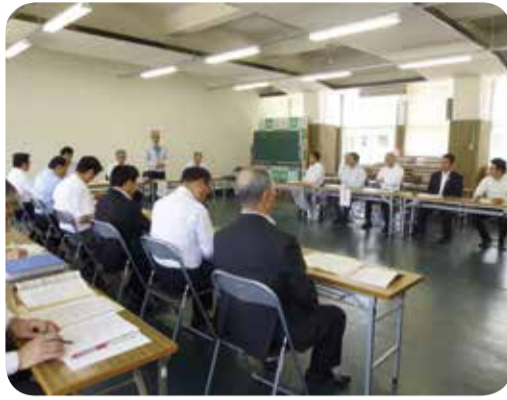
伊佐市との意見交換=伊佐市・5月

○火山防災対策について 活動を続ける霧島連山の火山防災対策について、伊佐市役所において硫黄山噴火に係る影響と対策に関して意見交換を行ったほか、霧島市役所において、新燃岳の防災対策に関して、住民等に対する噴火情報の提供方法や避難対策等について説明を受けました。