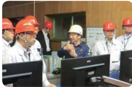
製糖工場の調査=中種子町・5月

5月には、種子島地区におけるさとうきび関連施設等の現地調査と意見交換を行い、11月には、農林水産省等に対し、さとうきび・でんぷん用かんしょなど甘味資源作物振興対策の充実・強化などを要望しました。