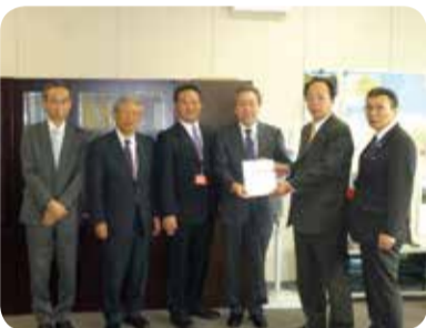
国土交通省への要望 =東京都・11月

8月には、離島行政懇談会に出席し、離島が抱える様々な課題について、県や市町村長と意見交換を行い、11月には、国土交通省等に対し、奄美群島振興開発特別措置法の延長などを要望しました。