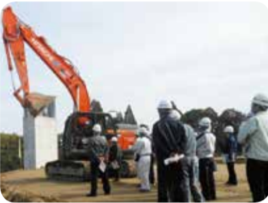
鹿屋串良JCT付近の現場研修 =鹿屋市・11月

11月には、沿線の各自治体から多くの職員等も参加し、東九州自動車道鹿屋串良JCT、志布志IC（仮称）等の工事の状況を視察し、また、国土交通省等に対し、全線開通に向けた整備推進などを要望しました。