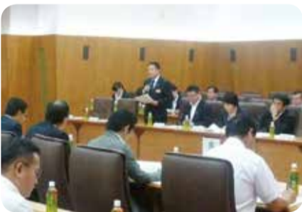
県観光業界等との意見交換 =鹿児島県議会・9月

9月には、県観光業界及び行政関係者との合同研修会を開催し、本県における観光の動向や振興策、諸問題等について意見交換を行い、11月には、知事に対し、県の当初予算編成での観光の振興などを要望しました。