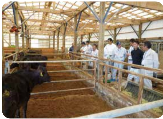
畜産農家の牛舎を視察=十島村・5月

○農業・水産業の振興対策について 畜産業の取組や漁港の整備状況等について現地調査を行いました。 また、畜産農家や漁業関係の方々との農水産業の現状と課題等について意見交換を行いました。