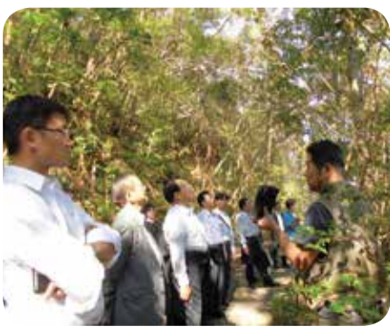
希少な野生動植物が棲息する金作原原生林=奄美市・11月

○保健・医療・福祉対策について 幼保連携型認定こども園を訪問し、子育て支援の取組について意見交換を行ったほか、県立大島病院を訪問し、ドクターヘリの運航状況や地域医療の課題等について調査を行いました。