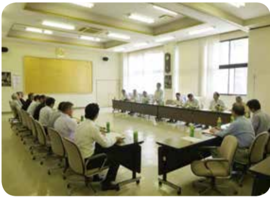
商工会との意見交換=南九州市・7月

○農業・水産業の振興対策について 畜産業の取組や漁港の整備状況等について現地調査を行いました。 また、畜産農家や漁業関係の方々との農水産業の現状と課題等について意見交換を行いました。