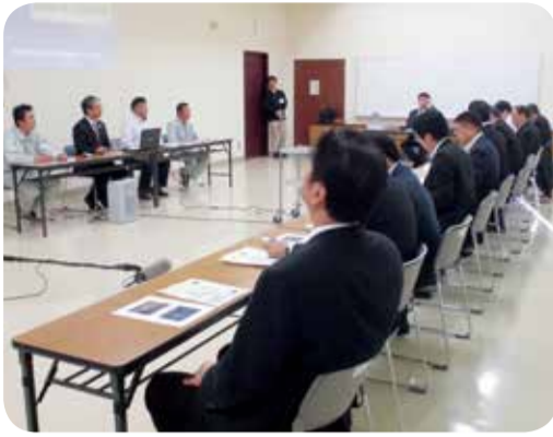
まちづくり団体の皆さんとの意見交換=鹿屋市・10月

○火山防災対策について 活動を続ける霧島連山の火山防災対策について、伊佐市役所において硫黄山噴火に係る影響と対策に関して意見交換を行ったほか、霧島市役所において、新燃岳の防災対策に関して、住民等に対する噴火情報の提供方法や避難対策等について説明を受けました。