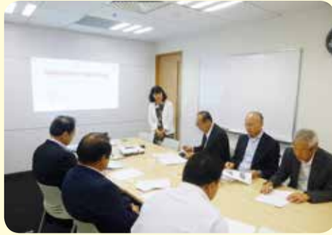
日本学生支援機構の視察調査 =ベトナム・8月