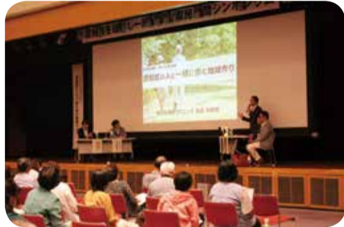
認知症を理解し一緒に歩む県民週間 シンポジウム=鹿児島県庁・9月

県民の認知症に対する理解を深め、認知症高齢者等にやさしい地域づくりを進めるため、県民週間初日となる9月16日(日曜日)に、県庁講堂においてシンポジウムが開催され、多くの県民の方々が参加されました。