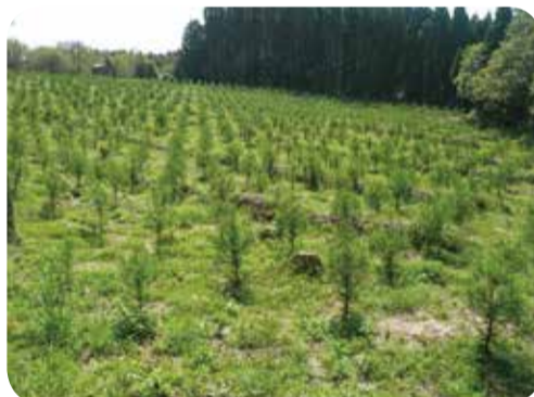
再生林施行箇所(造林補助事業)

条例の施行を受け、健全で持続的な森林を維持するための再生林や間伐など、森林資源の循環利用を促進するための施策が実施されています。