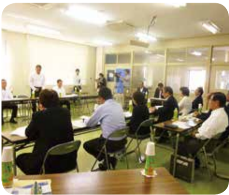
自動車学校職員との意見交換=西之表市・10月

○教育振興対策について 義務教育学校、特別支援学校、加工品開発等を行っている高等学校の取組について調査を行い、授業等を視察しました。 また、文化財を活用した観光振興に取り組んでいるNPO法人の方々との意見交換を行いました。