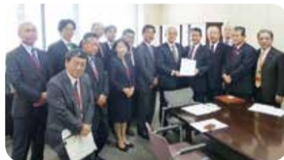
総務省への要望=東京都・11月

11月には、沿線の阿久根市、出水市及び薩摩川内市の各市議会議員連盟と合同で、関係機関、民間団体等との意見交換を行ったほか、総務省に対し、同鉄道の安定的な維持・存続のための財政支援などを要望しました。