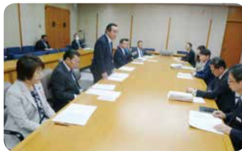
知事への要望=鹿児島県庁・11月

11月には、知事に対し、伝統的工芸品産業のさらなる振興・発展に向けた取組を要望しました。