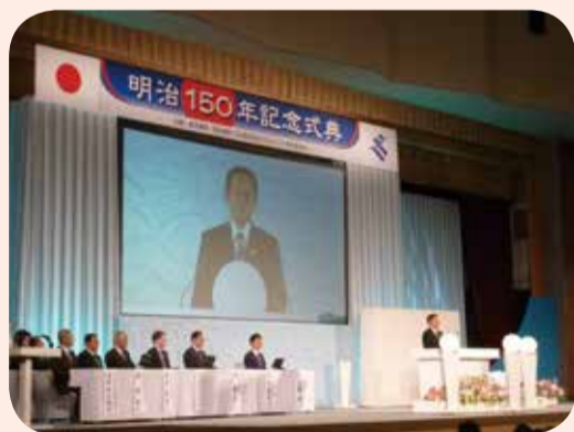
明治150年記念式典=鹿児島市・5月