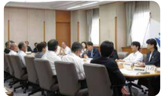
中山間地域等集落活性化推進本部 =鹿児島県庁・8月

地域づくりの実践者など、様々な方の御意見や県議会における議論も踏まえ、中山間地域等の集落活性化に係る指針が策定されることとなっています。