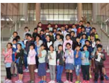
出水市立高尾野小学校のみなさん =県議会庁舎・10月

また、議会庁舎を見学することもできますので、希望される方は、お気軽にお申し出ください。