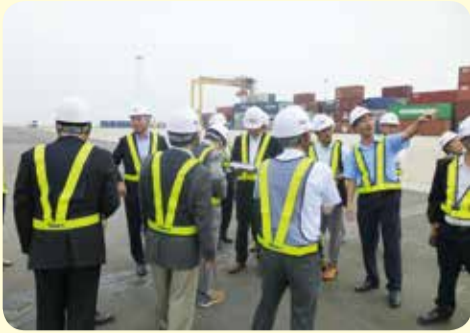
HICT社(ラックフェン港)の視察調査 =ベトナム・8月

8月には、ベトナムのハノイ鹿児島県人会や日本貿易振興機構ハノイ事務所、日本学生支援機構ベトナム事務所、HICT社（ラックフェン港）等を訪問し、アジア諸国との人やモノの交流促進について調査を行い、12月18日の定例会では、行政と企業等で連携した輸出体制の充実・強化などについて提言を行いました。