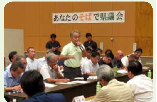
そば県(徳之島町・平成29年7月)