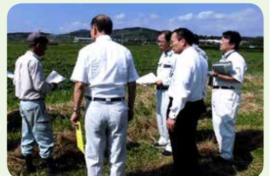
議員連盟(南さつま市・平成29年10月)