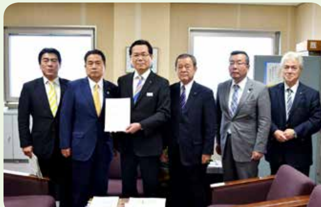
過疎・中山間地域の地域力強化 (平成30年3月)

この提言により、新たに「県民週間」を設けるなど、県民の認知症に対する正しい理解の普及等に取り組む事業が実施されています。