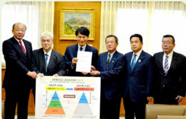
認知症対策 (平成29年12月)

この提言により、新たに「県民週間」を設けるなど、県民の認知症に対する正しい理解の普及等に取り組む事業が実施されています。