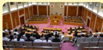
本会議及び委員会は、どなたでも傍聴できます。