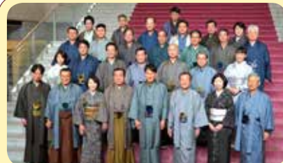
2月22日、大島紬の着物姿で定例会本会議に出席し、伝統的工芸品をPR