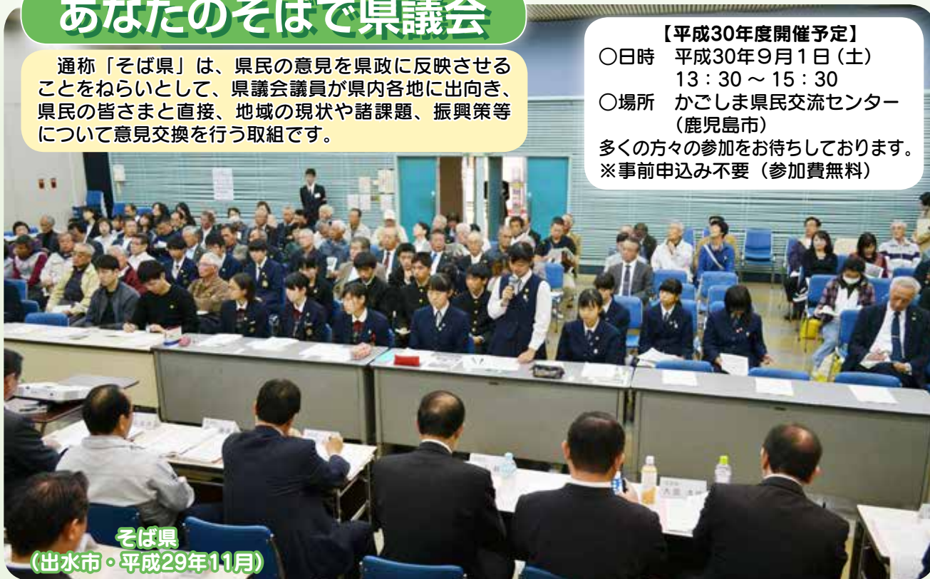
そば県 (出水市・平成29年11月)

【平成30年度開催予定】 ○日時 平成30年9月1日(土) 13:30～15:30 ○場所 かごしま県民交流センター (鹿児島市) 多くの方々の参加をお待ちしております。 ※事前申込み不要(参加費無料)