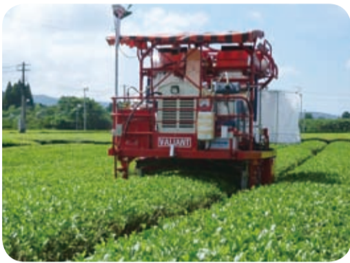
共同開発中の茶の無人摘採機(南九州市・7月)

また、南九州市の農業開発総合センター茶葉部において茶の無人摘採機の共同開発の取組を調査しました。