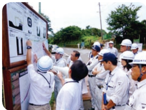
繰り返す地すべりの抜本対策の工事施工現場(南さつま市・7月)

港湾や河川改修事業、砂防や地すべり対策事業、公園等の整備状況について現地調査を行いました。