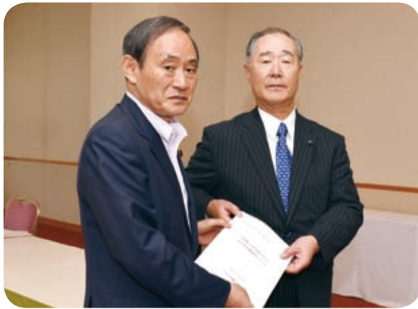
南九州西回り自動車道の早期完成について国に要請(6月)

6月4日、大規模な自然災害への対応として、人命と財産を守る社会資本整備への取組が極めて重要であることから、災害時における住民の広域避難や物資の緊急輸送などに大きな役割を担う重要な道路である南九州西回り自動車道の早期完成について、国に要請しました。