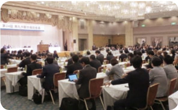
活発な意見交換が行われた南九州観光振興会議(11月)

11月、南九州3県(鹿児島県、熊本県、宮崎県)の観光振興議員連盟による第24回南九州観光振興会議を鹿児島市で開催し、誘客対策など南九州の観光振興について活発な意見交換を行いました。