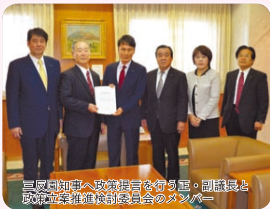
三反園知事へ政策提言を行う正・副議長と政策立案推進検討委員会のメンバー

12月16日、県議会政策立案推進検討委員会の検討結果を踏まえ、知事及び教育長に対し、政策提言を行いました。