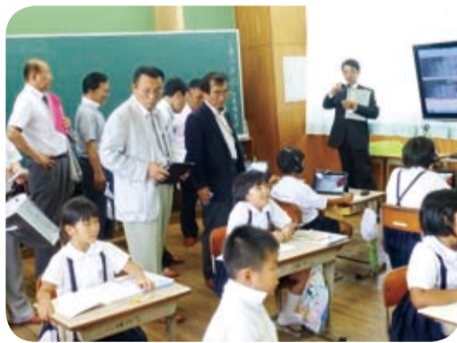
ICT機器を活用した授業に取り組む複式学級の児童(徳之島町・7月)

離島におけるICTの活用による授業改善の取組やアクティブラーニングによる学習指導などについて調査しました。