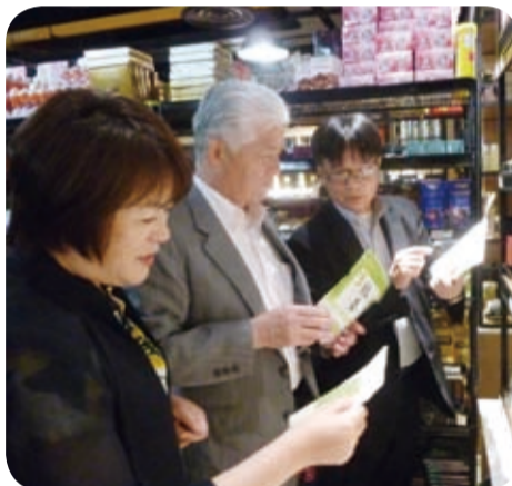
日本食品の流通状況の調査(ベトナム・11月)

同特別委員会は、海外経済交流を促進する施策等に関する調査を行っています。11月、タイの日本貿易振興機構や鹿児島和牛販売指定店、ベトナムの日本食レストランや現地のスーパーマーケット等を訪問し、日本からの農畜産物の輸入状況や流通状況等について調査を行いました。