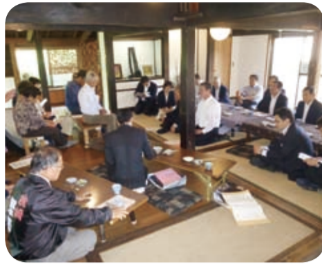
不登校児童生徒の受入など子育て支援に取り組むNPO法人との意見交換(枕崎市・5月)

地域において積極的に活動しているNPO法人等を訪問し、設立趣旨やこれまでの取組状況について説明を受けた後、地域活性化策や法人の運営上の課題等について意見交換を行いました。