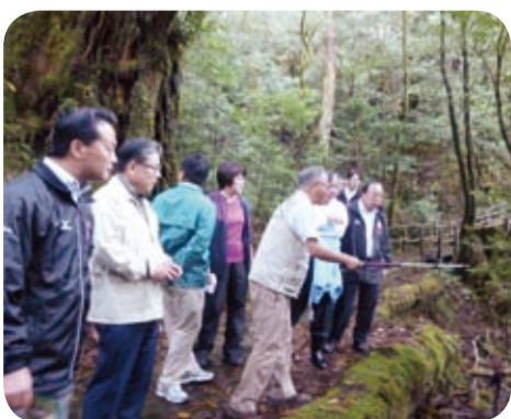
希少な野生植物の森を楽しむヤクスギランド(屋久島町・10月)

世界自然遺産の島・屋久島において、自然環境保全や地球温暖化防止の取組等について現地調査を行いました。