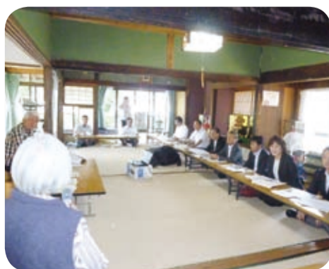
子どもからお年寄りまでの多世代交流に取り組む住民との意見交換会(南大隅町・5月)

種子島医療センターや多世代交流・多機能型拠点施設等を訪問し、地域の医療・福祉の課題等について意見交換を行い、現地を視察しました。