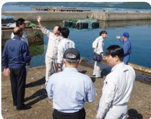
被害の大きかった宮之浦地区を視察(長島町・9月)

9月23日、産業経済委員会は、八代海で発生した赤潮による被害状況を調査するため、東町漁業協同組合の説明を受け、被害の大きかった宮之浦地区や死魚の埋設場所を視察しました。視察結果を基に第3回定例会で活発な質疑を行い、赤潮発生メカニズムの解明に取り組むよう要望しました。