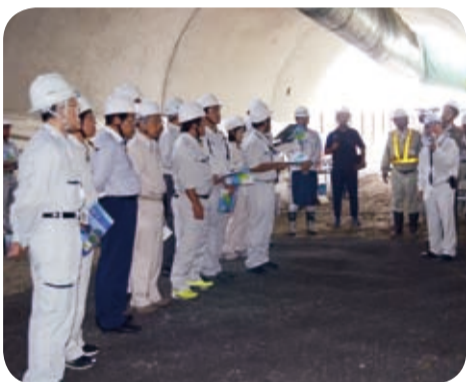
整備中の伊座敷バイパス(伊座敷トンネル)(南大隅町・10月)

南薩縦貫道や都城志布志道路の地域高規格道路、一般県道など県管理道路等の整備状況について現地調査を行いました。