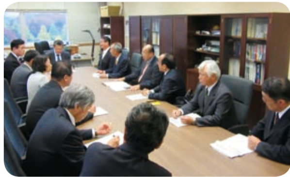
財政支援等について国に要望(11月)

11月、阿久根市及び出水市の議員連盟等と共に国土交通省等を訪問し、同鉄道の安定的な維持・存続のための財政支援等について要望活動を行いました。