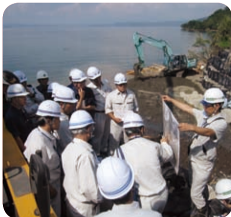
企画建設委員会による磯脇橋流失現場の視察(垂水市・9月)

台風16号による大隅地区の橋梁や河川、農業施設等の被災状況について、9月23日に企画建設委員会が、10月5日には産業経済委員会が被災現場を視察し、調査を行いました。視察を踏まえ、第3回定例会の常任委員会でも活発な議論が行われ、早急な対策を講じるよう要望しました。