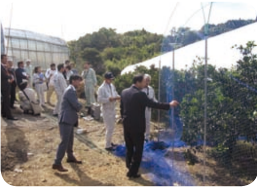
簡易設置型防鳥網の実証ほや等を視察(11月)

11月、北薩地域の現地視察を行い、出水市鳥獣被害対策実施隊の皆様と意見交換を行うとともに、簡易設置型防鳥網の実証ほやモンキードックの訓練状況を視察しました。