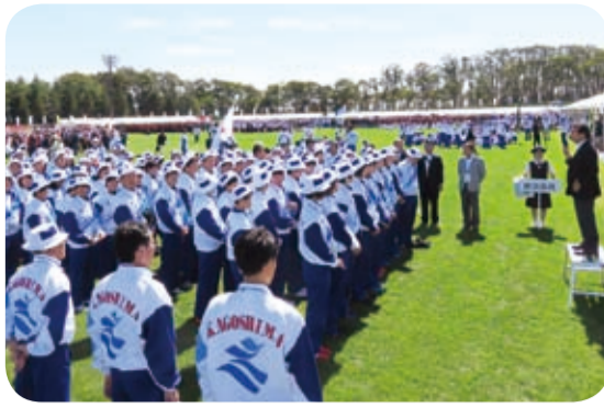
本県選手団を激励(10月)

10月、岩手県で開催された第71回国民体育大会開会式に参加し、本県選手団の激励を行いました。今年の本県選手団は、監督・選手ら436人が出場し、多くの競技で活躍を見せました。