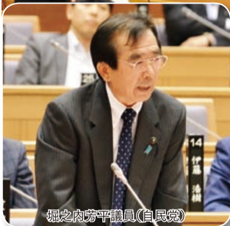
堀之内芳平議員(自民党)