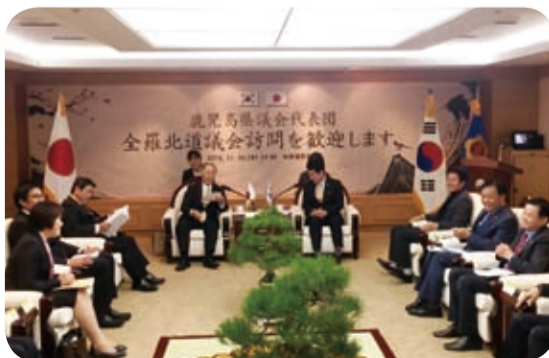
全羅北道議会にて意見交換を行う訪問団(11月)

観光・スポーツキャンプの振興について意見交換を行うとともに、今後も相互交流を継続していくことなどを確認しました。