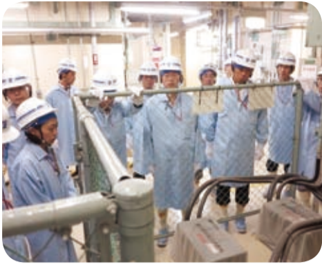
川内原子力発電所に設置されている地震計(薩摩川内市・7月)

また、南薩三市消防指令センターでは消防広域化の経緯について説明を受けた後、課題等について意見交換を行いました。