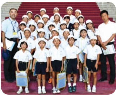
鹿児島市立郡山小学校の皆さん

また、議会庁舎を見学することもできますので、希望される方は、お気軽にお申し出ください。