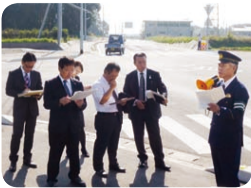
交通事故が多発する信号機の無い交差点(南九州市・11月) ※平成28年度中の信号機設置が決定

警察署、交番の概況等や交通事故が多発している信号機設置要望箇所を調査したほか、大学生少年サポーターの方々との意見交換を行いました。