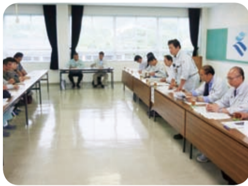
屋久杉加工の現状と課題について意見交換(屋久島町・5月)

伝統工芸品の振興策等について屋久島屋久杉加工協同組合や日置市の鹿児島県薩摩焼協同組合の方々との意見交換を行いました。