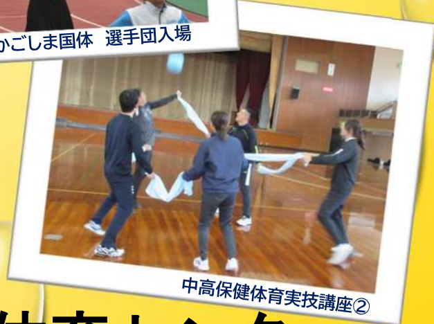
中高保健体育実技講座②