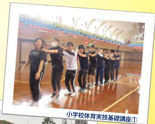
小学校体育実技基礎講座①