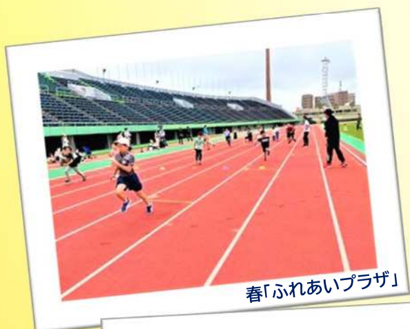
春「ふれあいプラザ」