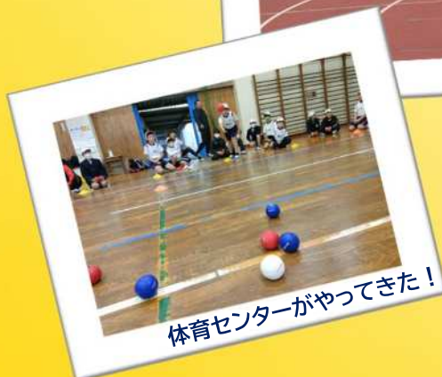
体育センターがやってきた!