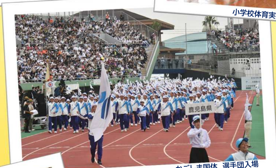
かごしま国体 選手団入場