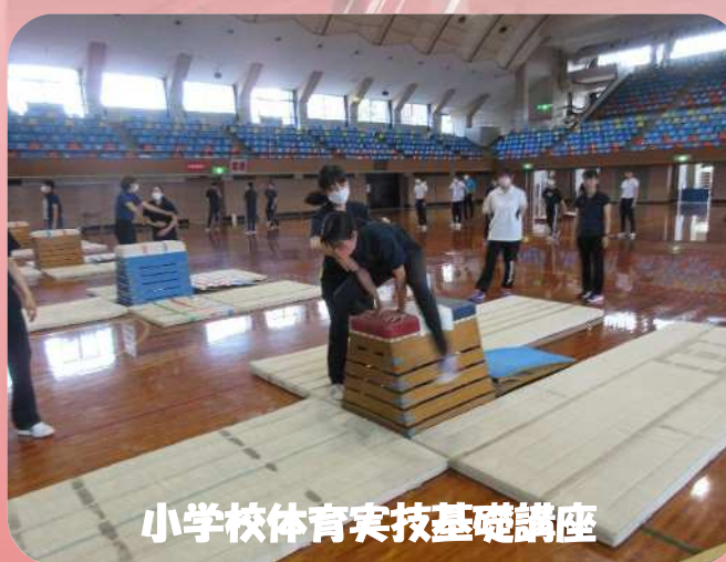
小学校体育実技基礎講座