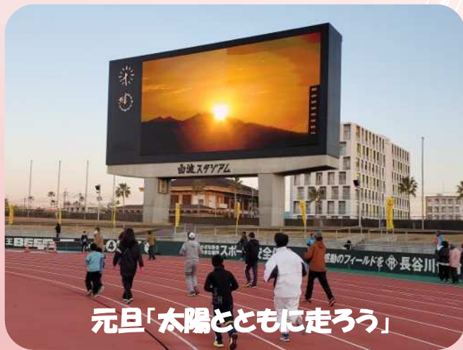
元旦「太陽とともに走ろう」