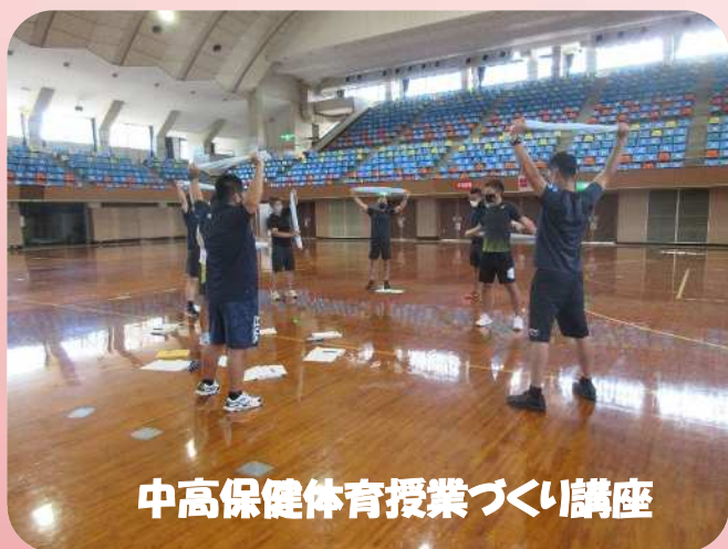
中高保健体育授業づくり講座