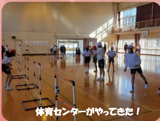
体育センターがやってきた！