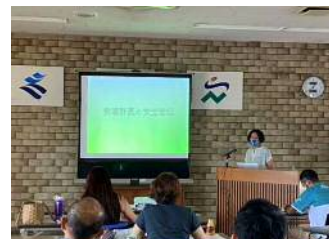
【指導計画と安全管理】