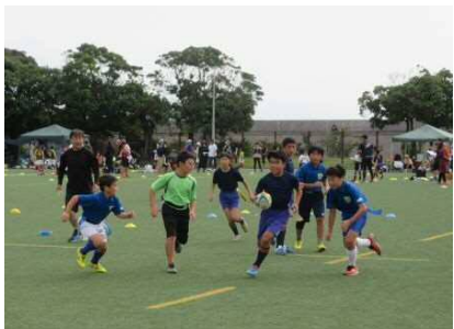
【タグラグビー・ミニラグビーフェスタ】