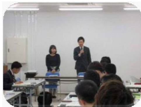
【情報交換会全体の様子】