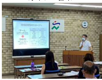
【地域におけるスポーツ振興】