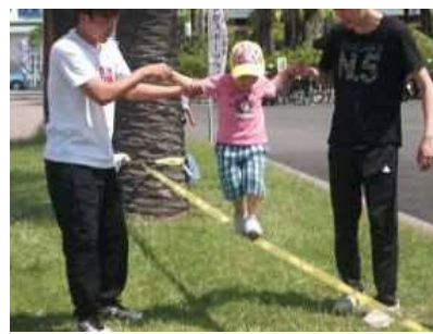
【ニュースポーツ体験(スラックライン)】