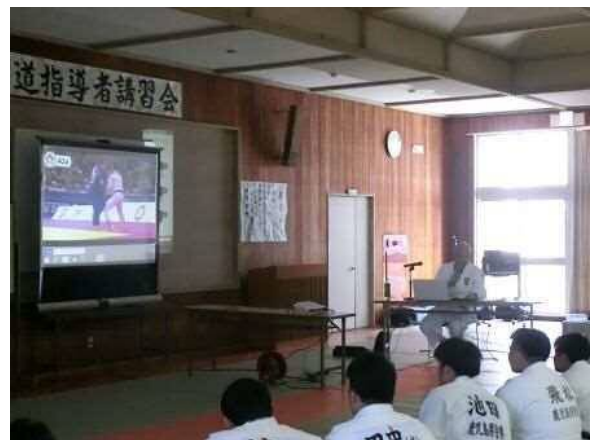
【講義：国際柔道連盟試合審判規定】