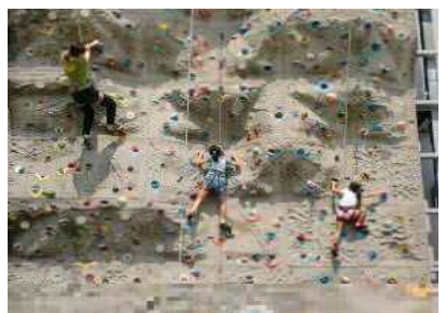
【スポーツクライミング】