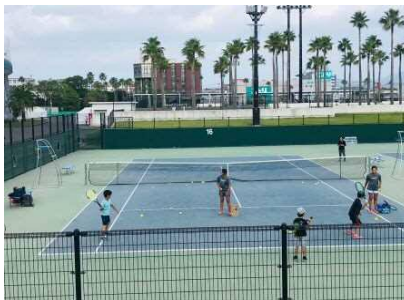
【テニスコート一般開放】