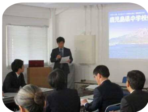
【県中学校体育連盟からの情報提供】