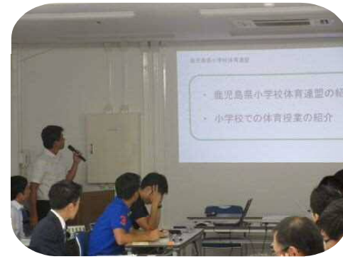
【県小学校体育連盟からの情報提供】