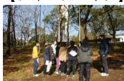
【ゲームプランニング実地調査】