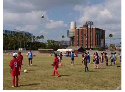
【鹿児島ユナイテッドFCサッカー教室】