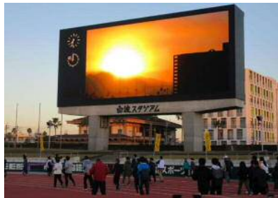
【大型ビジョンに映える初日】