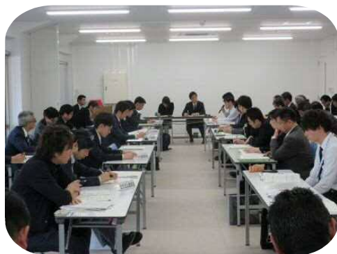
【情報交換会全体の様子】