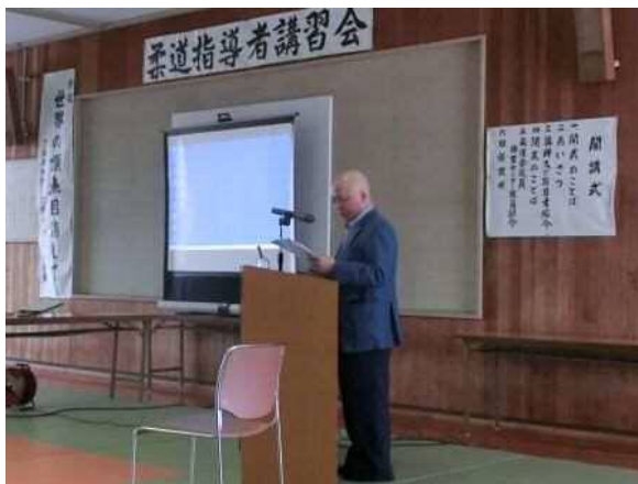
【講義：世界の頂点目指して】