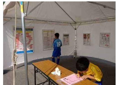
【コミュニティスポーツクラブコーナー】