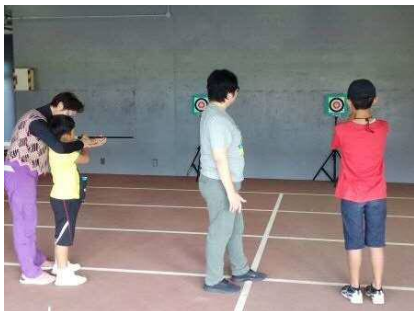
【スポーツウェルネス吹矢体験教室】