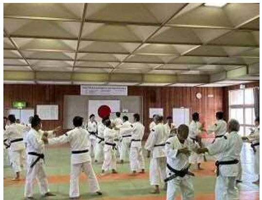
【 模 擬 授 業 】