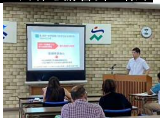
【ジュニア期のスポーツ】