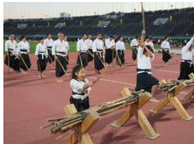
【薬丸野太刀自顕流保存会】