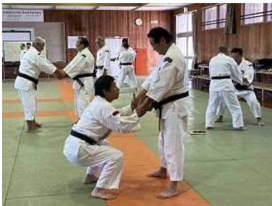
【 実 技 】