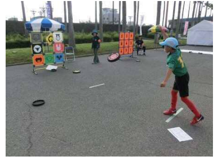
【ニュースポーツ体験コーナー】