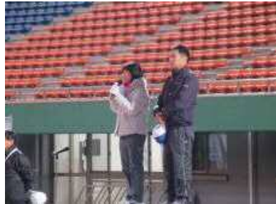
【ゲストランナー紹介】