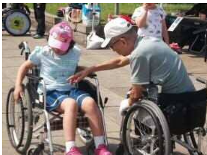
【車いすスラローム】