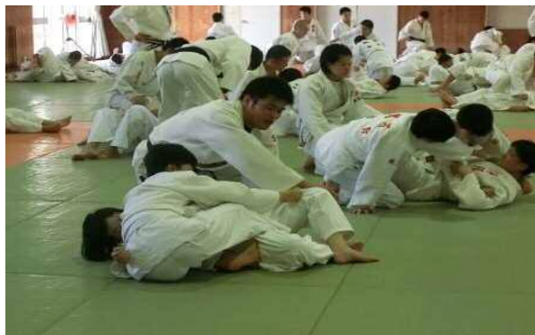
【柔道 (抑え込み練習)】