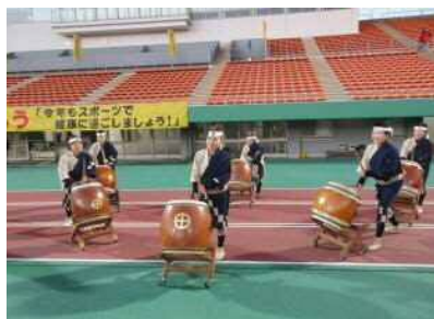
【薩摩チェスト太鼓保存会】