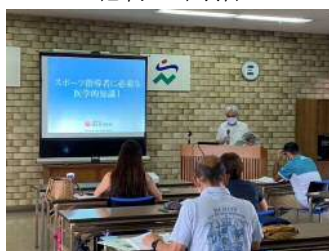
【スポーツ指導者に必要な医学的知識Ⅰ】