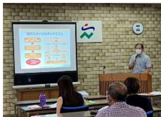
【文化としてのスポーツ】