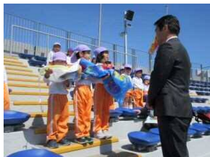
【プレイベント（こいのぼり贈呈）】