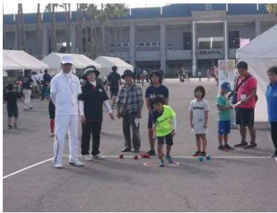
【ペタンク体験教室】