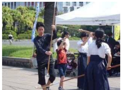
【なぎなた体験教室】