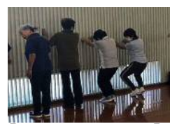
【筋力トレーニング】