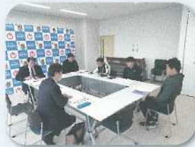
徳之島町教育委員会との情報交換