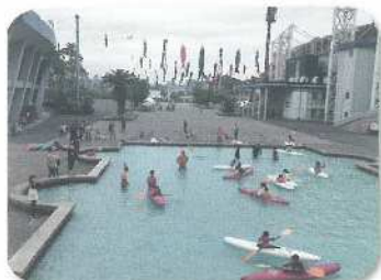
R5 春「ふれあいプラザ」