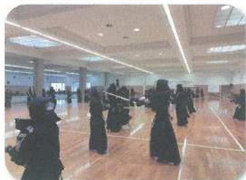
R5 地方青少年武道錬成大会（剣道）