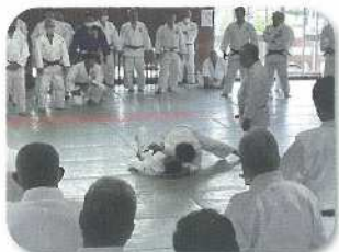
柔道指導者講習会