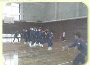
職員派遣事業（令和5年度） 鹿兒島県消防学校 初任教育