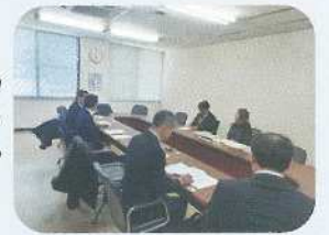
きもつきスポーツクラブと 肝付町教育委員会との情報交換