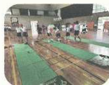
スカットボール体験

実施日、活動時間、活動内容については、個別に対応の上、実施します。実施の際は、学校職員に運営の御協力をお願いする場合があります。