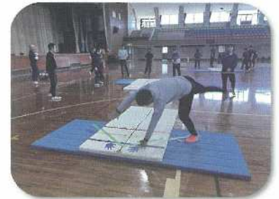
器械運動系：マット運動