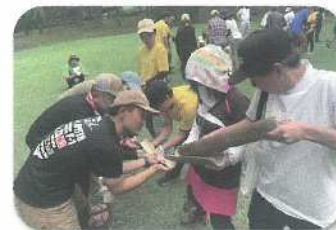
アウトドア活動指導者育成講習会