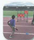
ディスクゲッター