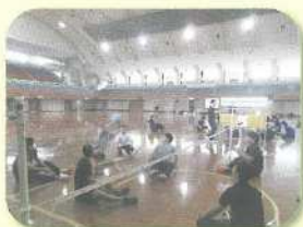
シッティングバレー