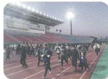
R6 元旦「太陽とともに走ろう」