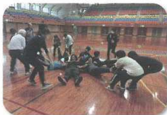
スポーツ・レクリエーション活動実技指導者研修会