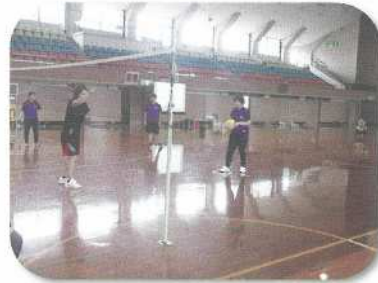
球技：ネット型（バレーボール）