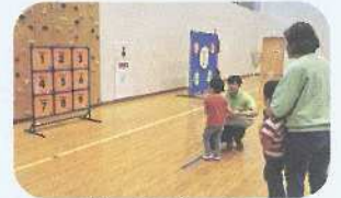
～ディスクゲッター～