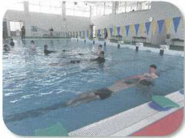
水泳運動系・水泳