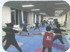
～かんたんヨガ体験～