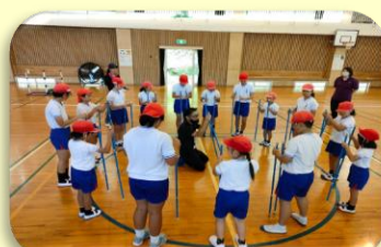
キャッチング・ザ・スティック体験

実施日、活動時間、活動内容については、個別に対応の上、実施します。実施の際は、学校職員に運営の御協力をお願いする場合があります。