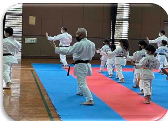
地方青少年武道錬成大会(空手道)