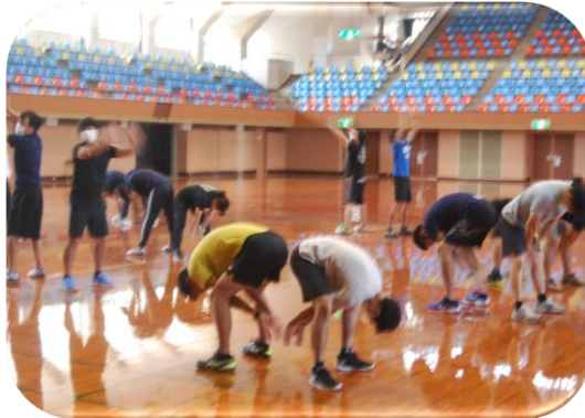
体づくり運動：体の柔らかさを高めるための運動