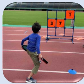
ディスクゲッター