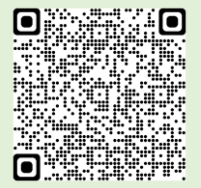
令和4年度認定クラブ一覧表QRコード