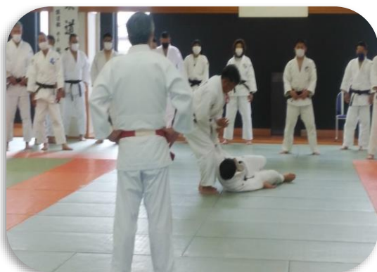
柔道指導者講習会