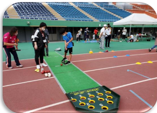
秋「スポーツプラザ」