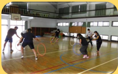
体づくり運動 (多様な動きをつくる運動)

校種間の系統を踏まえた講義や実技研修を行い、先生方の指導力の更なる向上を目指します。