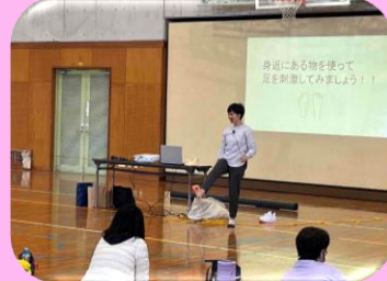
～女性のための温活～