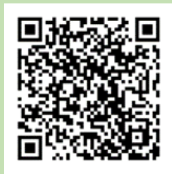
ホームページQRコード

総合体育センターで作成した体づくり運動など、各領域の実例の動画をホームページで紹介しています。 令和4年度は、体づくり運動、水泳の動画をHPに掲載しています。ぜひ御活用ください。