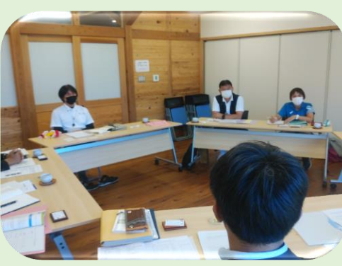
やくしま仲よしコミスポクラブと屋久島町教育委員会との情報交換

運営状況調査 総合型地域スポーツクラブの運営状況を把握し、地域における生涯スポーツの推進について、情報交換を行います。 令和4年度は、やくしま仲よしコミスポクラブとNPO法人ヨロンSCの運営状況調査を行いました。