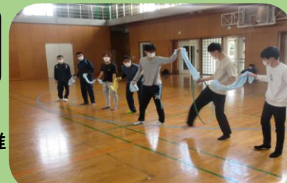
職員派遣事業(令和4年度) 鹿児島県立農業大学校