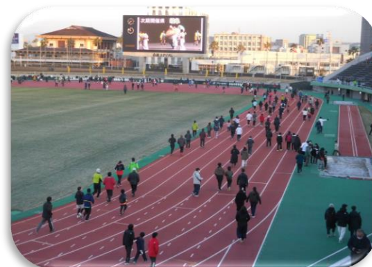
元旦「太陽とともに走ろう」

指導者の養成と資質向上市町村及び地域の指導者養成への支援として、総合体育センター職員の派遣を行っています。