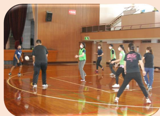
ゴール型：ハンドボール