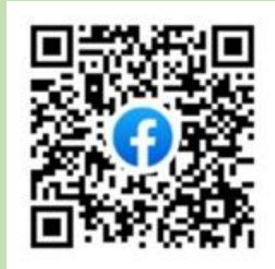
フェイスブックQRコード

体育センターの様々な行事や研修会の様子等を投稿しています。イベントの告知やイベントの裏側、研修会の様子等をアップしていきますので、フォローしてください。