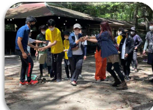
アウトドア活動指導者育成講習会