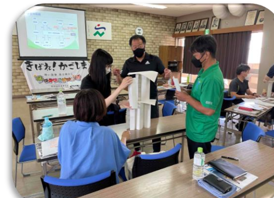
公認アシスタントマネジャー養成講習会