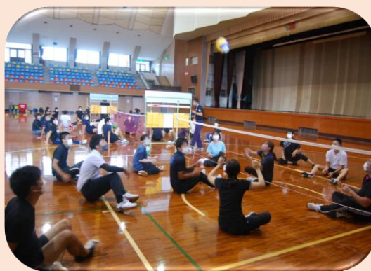
シッティングバレー