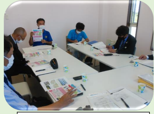
NPO法人ヨロンSCと与論町教育委員会との情報交換

認定クラブ制度 総合型地域スポーツクラブの運営方法や組織体制の改善、強化を図るとともに、県・市町村行政・総合型地域スポーツクラブの三者相互の連携充実を図ることにより、県民の生涯スポーツ振興の寄与につなげることを目的として、「鹿児島県広域スポーツセンター認定クラブ制度」(認定クラブ制度)を行っています。 令和4年度は、37クラブが認定されました。