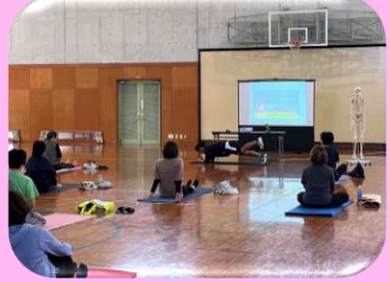
～呼吸と骨盤について～

女性のためのスポーツ・レクリエーション教室 (令和4年度主管クラブ：NPO法人ASA奄美スポーツアカデミー：奄美市)