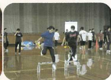
陸上運動系・陸上競技 (ハードル走)