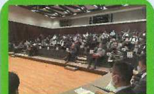
広域スポーツセンター研修会