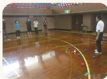
パラリンピック競技体験 (ポッチャ)