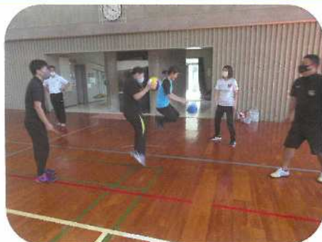
体づくり運動：巧みな動きを高めるための運動