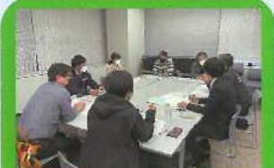
広域スポーツセンター研修会

あなたの身近に コムスポがあります! (あなたのまちなりのコムスポは、総合体育センターのホームページでチェック👉)