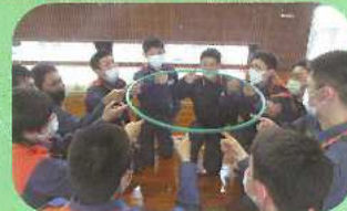
職員派遣事業(令和3年度) (鹿児島県消防学校初任教育)