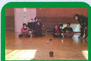
人気の「ボッチャ」体験!