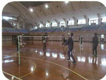
球技（ネット型）：バドミントン