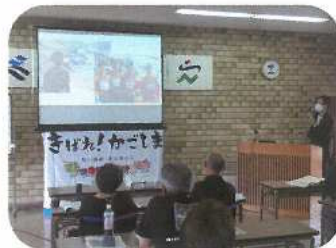
スポーツ・レクリエーション活動リーダー養成講習会