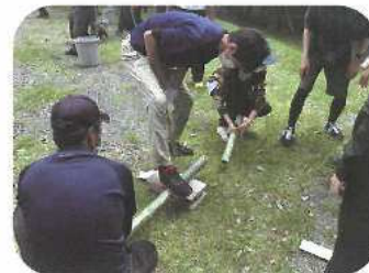
アウトドア活動指導者育成講習会