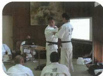
柔道指導者講習会

市町村及び地域の指導者養成への支援として、総合体育センター職員の派遣を行っています。