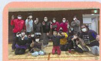
大人も子供もスポーツで仲良し!