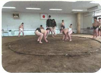
地方青少年武道錬成大会（相撲）