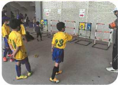
春「ふれあいプラザ」