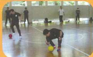
体づくり運動(体ほぐしの運動) [写真は、令和2年度の様子]