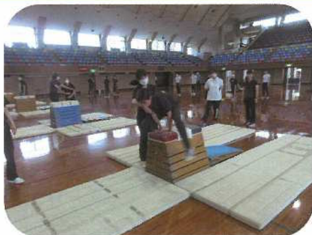
器械運動：跳び箱運動