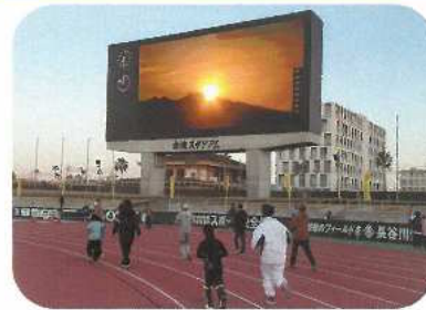
元旦「太陽とともに走ろう」