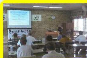
スポーツ・レクリエーション活動 リーダー養成講習会