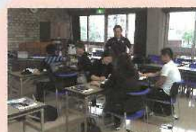
公認アシスタントマネジャー 養成講習会