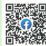
フェイスブックQRコード

ソーシャル・ディスタンスを保ちながら行える「体づくり運動」や事業等の動画や画像を掲載中。