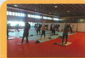
「ピラティス」で心も体もホットに!