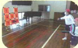
ディスクゲッター

実施日、活動時間、活動内容については、個別に対応の上、実施します。実施の際は、学校職員に運営の御協力をいただきます。