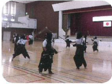
地方青少年武道錬成大会（なぎなた）