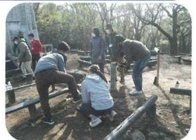
アウトドア活動指導者育成講習会