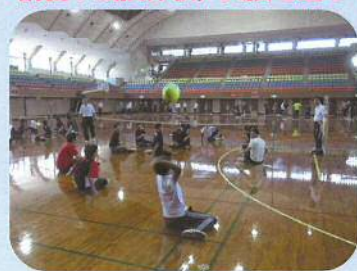
パラリンピック競技体験 (シッティングバレーボール)

会場：県総合体育センター体育館 (通称：県体育館) 講義や競技体験，実技を通しての研修となります！