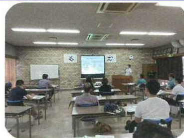
スポーツ・レクリエーション活動リーダー養成講習会