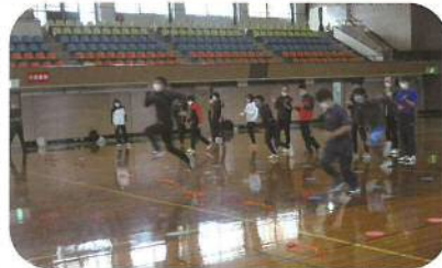
陸上競技：走り幅跳び