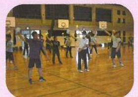
職員派遣事業 (令和2年度) (始良市教育委員会研修会)