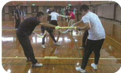
体づくり運動：体のバランスをとる運動 (遊び)