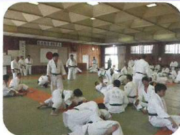
柔道指導者講習会（令和元年度）

市町村及び地域の指導者養成への支援として、総合体育センター職員等の派遣を行っています。