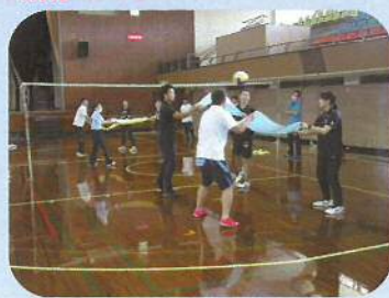
ボール運動系・球技 (ネット型：バスタボー)