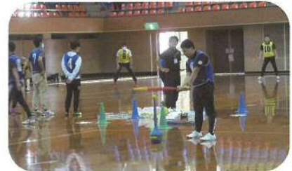
ボール運動系：ティーボール