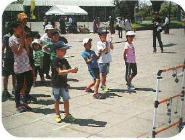
春「ふれあいプラザ」