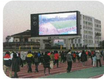
元旦「太陽とともに走ろう」