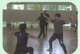
体づくり運動 (多様な動きをつくる運動)