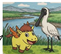
鹿南少マスケット「ペガちゃん」