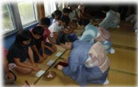
礼法室での茶道教室