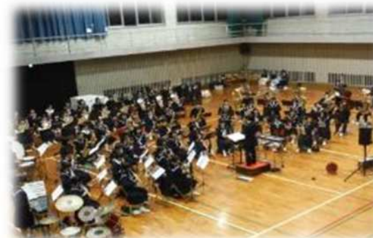
体育館での吹奏楽練習