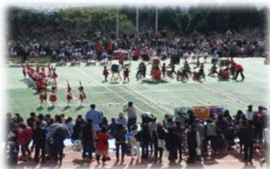
つどいの広場での幼稚園運動会