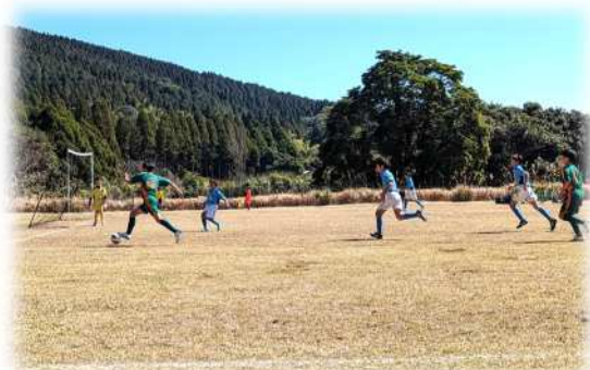
スポーツ研修ゾーンでのサッカー大会