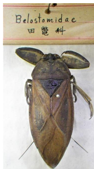
上荒田にいた希少種・タガメ

標本箱の側面にあるタイトルには見慣れぬ文字が並びます。鳳蝶科（現在のアゲハチョウ科）、金亀子科（コガネムシ科）、埋葬虫科（シテムシ科）、椿象虫科（カメムシ科）、紅娘草科（テントウムシ科）など。現在は科名や種名がカタカナ表記なので、すべて漢字で書かれていると、さてどんな虫だろうと一瞬戸惑います。