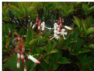
ヤクシマホツツジ

高さ1m～2mの落葉の低木です。明るい林縁や岩場などに生えます。枝先に白や少し赤みがかかった花を垂直に咲かせる姿から、「穂ツツジ」と名がついたと言われています。黒味岳の登山道沿いや山頂付近に生えていました。