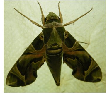
キョウチクトウスズメ成虫

さて、毎年のように観察される本種ですが、実は鹿児島県本土には越冬できない偶産蛾 ぐうさんか として有名です。もともとはアフリカからインド、東南アジアにかけ