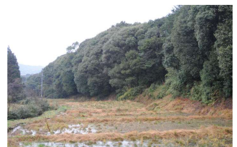
産卵場の環境（出水市高尾野町）

残念なことに、以前カスミサンショウウオがすんでいた場所でも、現在は見られなくなってしまった場所もあります。カスミサンショウウオが生きていくには、成体のすみかである森林と、産卵場や幼生のすみかである湿地や水田が必要で、なおかつ、その間を行き来できる必要があります。このような環境が、今後も保たれるようにしたいものです。