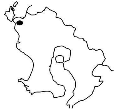
県内の分布域（黒色部）

カスミサンショウウオが県内で見つかったのは、1988年のことです。その後、たくさんの人が調べて、県内では出水平野の西部（出水市西部と阿久根市の北東部）だけに分布することが