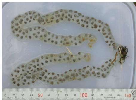
産卵直後の卵のう (水から取り出して撮影)

これは、カスミサンショウウオの卵が入った「卵のう」です。そして、上の写真の卵のうに入っている1cmほどの細長いものは、ふ化間近の胚なのです。カスミサンショウウオは、カエルやイモリと同じ両生類で、たくさんの卵が包まれた卵のうを、水中に産みます。卵のうはコイル状に巻いた細長い形をしていて、1対あります。中には数十個から数百個の卵が入っています。