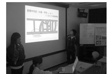
成果発表会（12月）の様子 （屋久島環境文化村センターにて）

9月には各分野合同で中間発表を行い、課題や今後の見通しを確認し、12月には、活動のまとめを行いました。また、成果や課題など調べたことを屋久島町の一湊公民館や屋久島環境文化村センターにおいてポスター発表を行い、広く町民の方々にもこの講座での取組みや成果および課題を発表しました。この講座を通して、受講者の中高生は屋久島の自然から多くのことを学ぶことができました。