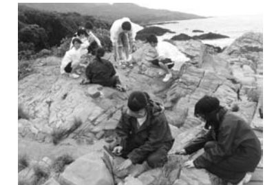
宮之浦海岸の地層を調べる中高生（6月）

分野ごとに博物館の学芸主事や外部講師から助言を受けながら、数回にわたり野外調査を行いました。