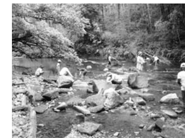
自然調査会の様子

もちろん、会場では、大人気の「さわっていいよ」コーナーや鹿児島と世界の昆虫、鹿児島島の天然記念物、児童生徒の理科作品などを展示しました。また、楽しい実験「とほうもなく冷たい世界」や「星砂をさがそう」も大好評でした。