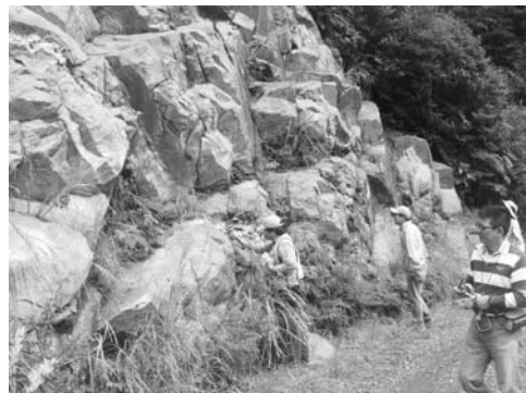
花崗岩の露頭調査（高隈山系）