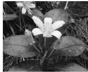
タカクマホトトギス

イヌシダやベニシダなどのシダ植物や高隈山系が発見地のタカクマホトトギスやタカクマヒキオコシなど約50点。