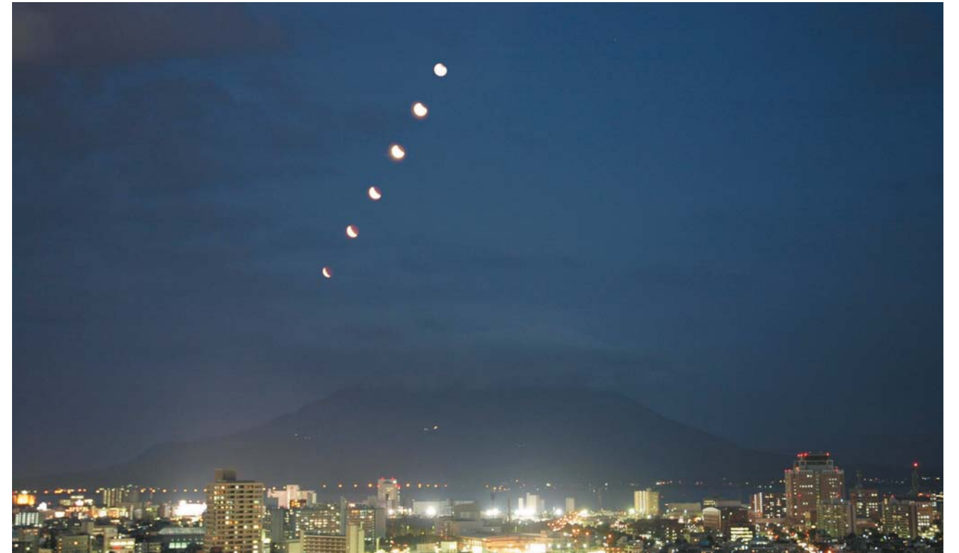
桜島と月食 2010年12月21日18:10～19:00（10分おきの写真を6枚合成）鹿児島市紫原から撮影

●鹿博だより 編集・発行 鹿児島県立博物館 〒892-0853 鹿児島市城山町1番1号 TEL099-223-6050 FAX099-223-6080 http://www.pref.kagoshima.jp/hakubutsukan/