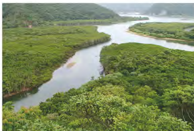
住用マングローブ