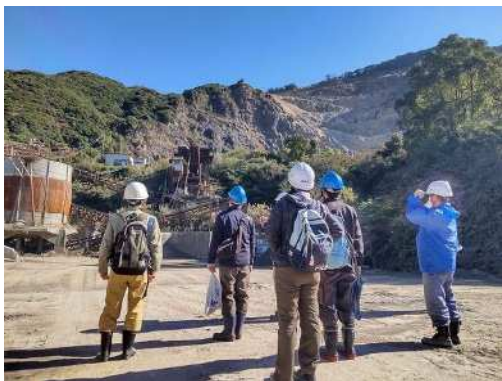
フィールドワーカー養成講座

展 示 内 容：鹿児島と世界の昆虫，鹿児島の天然記念物，児童・生徒の理科作品 さわってみよう（化石），郷土の自然 楽しい実験：「とほうもなく冷たい世界」，「キャップゴマ作り」などの工作や体験活動 野 外 活 動：自然観察会，星空観察会 郷土の自然紹介授業：植物，地質，動物，昆虫，天文の5分野