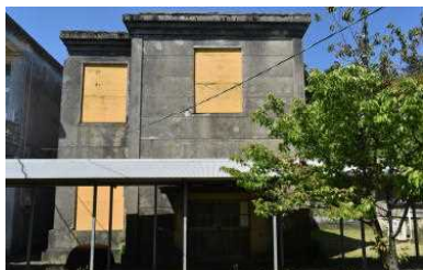
【徳之島町】 旧山尋常高等小学校校舎