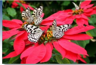
オオゴマダラ(喜界町)