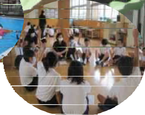
互いに認め支え合う