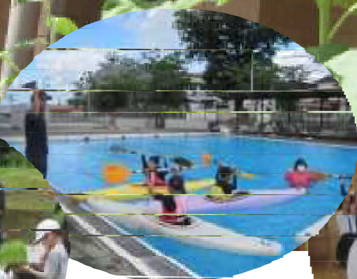
ふるさと 菱刈に学び