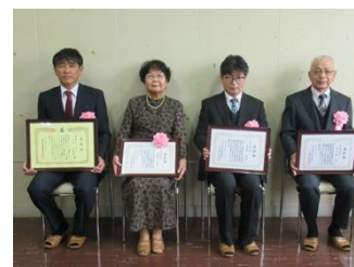
被表彰者の皆さん