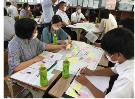
【グループ協議の様子】

分科会では、2年生と3年生に分かれ、授業研究・研究協議を行いました。授業研究では、会場校研究テーマに沿って、「自己の変容を実感させる工夫」、「多面的・多角的思考を促す工夫」、「ICTの活用」について意見交換を行いました。研究協議では、地区研究主題である「考え、議論する道徳」の充実に向けて各学校の取組や日頃の授業での工夫等について、グループで意見交換を行いました。