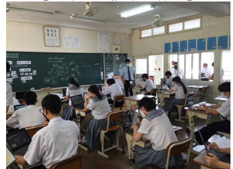
【3年生の授業の様子】