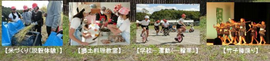
【米づくり(脱穀体験)】 【郷土料理教室】 【学校一運動(一輪車)】 【竹子棒踊り】

竹子小学校では、11月1日(金)～7日(木)を中心として、 自由な授業参観や保護者・地域の方々とのふれあい活動を計画 しています。 ※2日(土)～4日(月)はお休みになります。