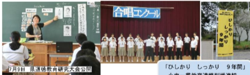
7月9日 県道徳教育研究大会公開