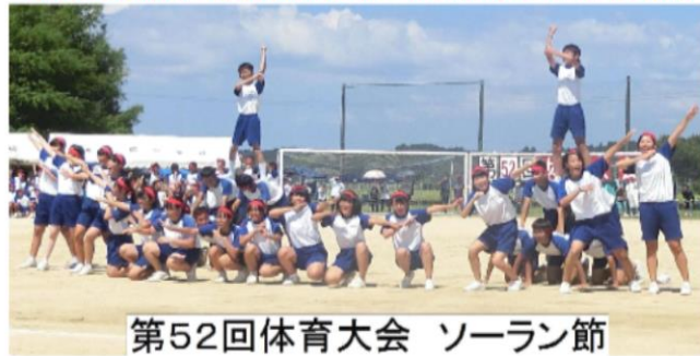
第52回体育大会 ソーラン節

学校開放期間 11月5日(火)~8日(金) 授業の様子など御自由に参観してください。