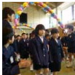
入学式の様子 (阿久根小学校)