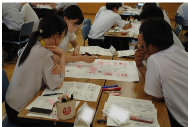
講義・演習 「連携協働力の向上と学校組織マネジメントについて」