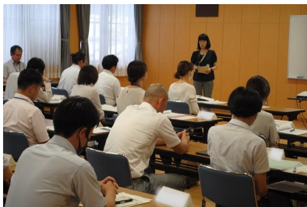
イントロダクション ～育成指標を基に自分の課題や本研修で 学びたいことについて考える～